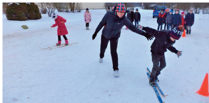
Slēpošanas stafetē bija nepieciešami palīgi.

Donānes izdomātajās jautrajās stafetēs ar ziemas sporta elementiem.