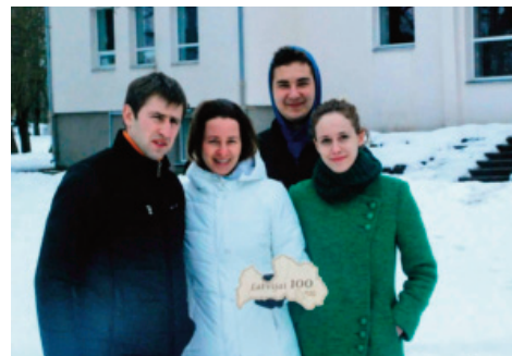
Ģeidānu ģimene pie Zasas kultūras nama