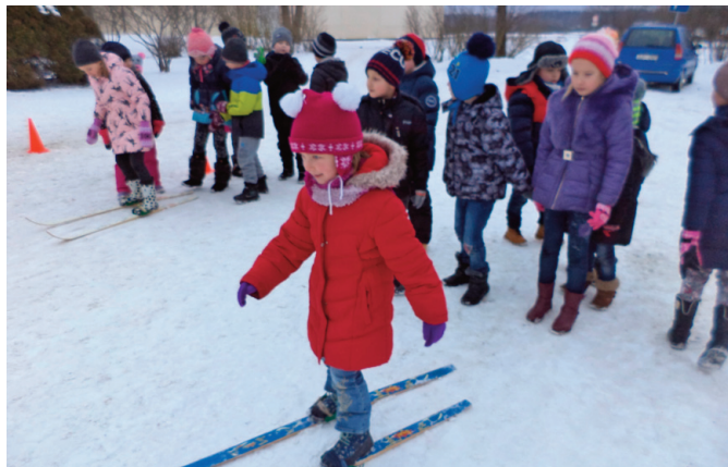
Pirmo reizi uz slēpēm!