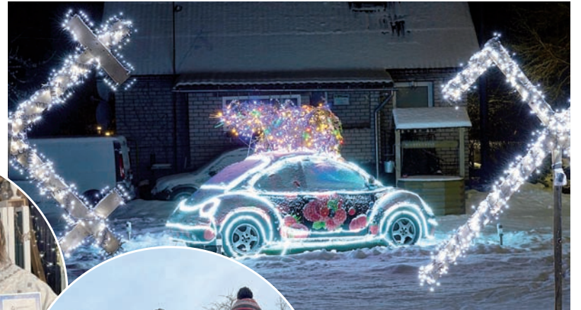
Pašvaldības domes priekšsēdētāja vietniece Ģita Mūrniece sveic Elstiņu ģimeni no Variņiem.