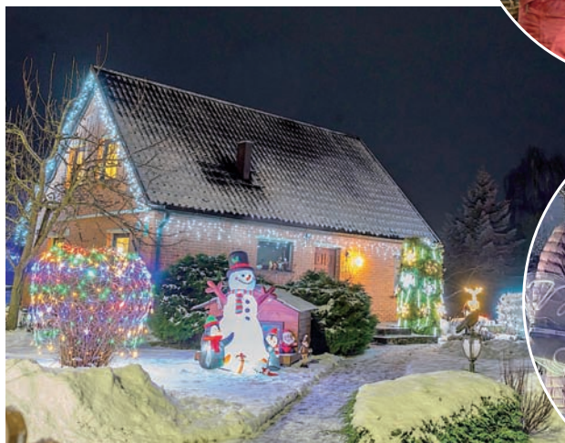
Pašvaldības domes priekšsēdētāja vietniece Ģita Mūrniece sveic Kraukļu ģimeni no Blomes.