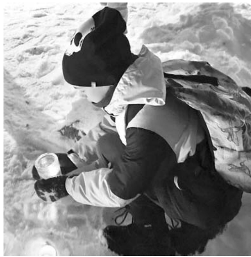
Smiltenes vidusskolas skolēni, pieminot 1991. gada janvāra notikumus un sasildot Latviju, pie skolas iedēdza pašu gatavotās ledus laternas.

Pirmsskolā, atsaucoties uz vecāku aptaujā izteikto vēlmi izglītoties bērnu attīstības jomā, notika „Vecāku kafejnīca”, kurā pieredzē