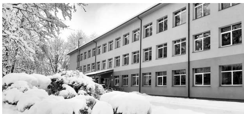
Smiltenes tehnikumā šobrīd profesiju apgūst 744 audzēkņi no visas Latvijas. Izglītības kvalitāte, laba materiālā bāze un sadarbība ar uzņēmējiem ir svarīgākie priekšnoteikumi, lai sagatavotu Latvijas tautsaimniecībai zinošus jaunus speciālistus.

Tehnikuma direktors jaunajā gadā plāno intensīvi strādāt, lai at-