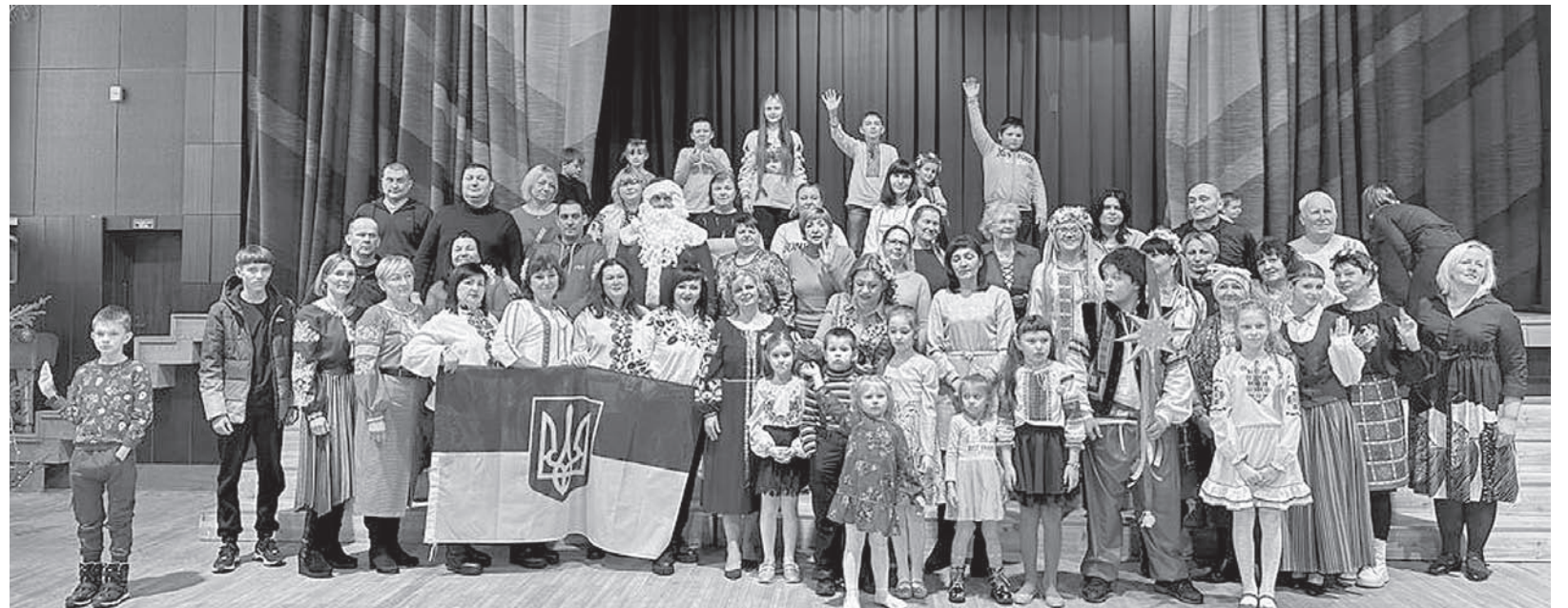
Ziemassvētku pasākums un Ukrainu svētā Mikolaja dienas svinības.

Projekta ietvaros notika Ukrainas Neatkarības dienas atzīmēšanas pasākums, kopīga sporta diena ar novada audžuģimenēm, izglītojošas nodarbības un lekcijas par Latvijas vēsturi, valsts pārvaldi, demokrātijas izaicinājumiem, uzņēmējdarbību un tās uzsākšanas iespējām. Tāpat organizētas vairākas ekskursijas uz nozīmīgiem Latvijas dabas, vēstures, kultūras objektiem un radošās nodarbības, kur apgūtas latviskās un gadskārtu svinēšanas tradīcijas.