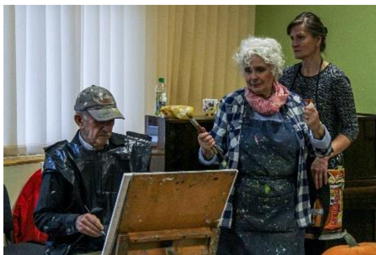
Gleznotāju nodarbībās valda radoša atmosfēra