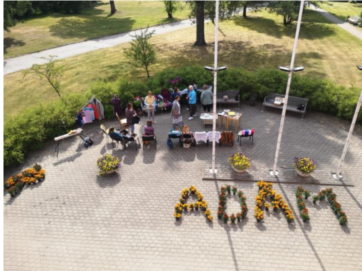
Pasākuma kopskats no bibliotēkas loga

Jaunpiebalgas bibliotēkā notika 3 kopīgas vakarēšanas, kurās interesenti varēja iemācīties adīt pārļotus pulsa sildītājus jeb maučus, aust rokassprādzes no pērlītēm.