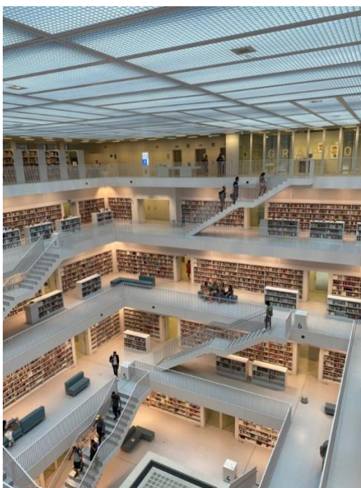
Štutgartes pilsētas bibliotēka

Katrs pieredzes brauciens, apmeklējot lielākas vai mazākas bibliotēkas, ir ieguvums profesionālajai izaugsmei, tā ir Eiropas kultūrvides apzināšana, tā ir tikšanās ar kolēģiem.