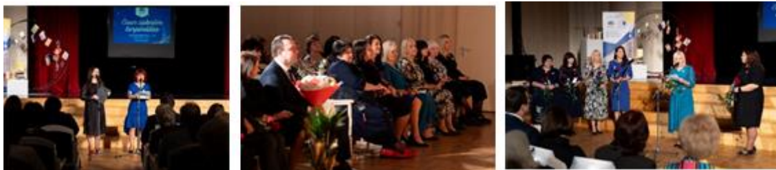
28.10.2023. Smiltenes bibliotēkas simtgades sarīkojums “Caur saknēm turpināties”

Zibakcija “Gaismas ceļš” pulcēja 97 dalībniekus – gan pieaugušos, gan bērnus – un izveda bibliotēkas simtgades sapņu stāstu ārpus bibliotēkas telpām Smiltenes ielās. 27. oktobrī – dienu pirms simtgades sarīkojuma “Caur saknēm turpināties” pie Bērnu apkalpošanas nodaļas aizsākās bibliotēkas simtgades “Gaismas ceļš”, kura laikā norisinājās akcijā “Palīdzi gaismā spīdēt” izgatavoto lukturīšu nogādāšana topošajā Viedrades kvartālā, lai izgaismotu sapni par Smiltenes Gaismas pili. Tās norise apvienoja visu paaudžu smilteniešus. Gaismas akcija vakara tumsā vēl ilgi prēcēja