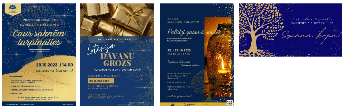
Daži no Smiltenes bibliotēkas simtgades vizuālajiem materiāliem

Plānojot Smiltenes bibliotēkas simtgades pasākumus, īpaši tika piedomāts par vienotu publicitātes stilu – visas pasākumu afišas tika veidotas tumši zilās, ar zelta krāsas elementiem un katrā vizuālajā materiālā tika iekļauts koks. Koks simboliski attēloja pasākuma nosaukumu “Caur saknēm turpināties”.