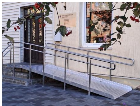
Uzbrauktuve pie Smiltenes bibliotēkas ieejas, Baznīcas laukumā 13

Pēc ielas rekonstrukcijas Smiltenes bibliotēka Baznīcas laukumā 13 atkal ir pieejama iedzīvotājiem gan ar kustību traucējumiem, gan ar bērnu ratiņiem. Arī senioriem ir kur pieturēties, kāpjot pa kāpnēm. Atskaites periodā izgatavota un pie bibliotēkas ieejas uzstādīta alumīnija uzbrauktuve. Tā ir pārvietojama, vieglas konstrukcijas un nerūsējoša, izmaksas – 2946 eiro.