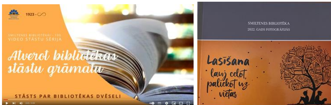
Pa kreisi: Video stāstu cikla noformējums. Pa labi: Fotogrāmata