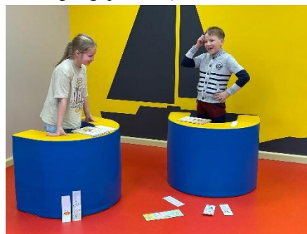
“Grāmatu duelis” Valkas Jāņa Cimzes ģimnāzijā

Interesu izglītības programmas “Lasīšanas darbnīca” ietvaros Valkas Jāņa Cimzes ģimnāzijas 2. klasē aizvadīta Valkas bibliotēkas Bērnu literatūras nodaļas organizēta grāmatu lasīšanas sacensība “Grāmatu duelis” (TE). Lai nodrošinātu visus nepieciešamos grāmatu eksemplārus pa divi, tika izmantots SBA ar Smiltenes bibliotēku un Vijciema bibliotēku. (Lasīt vairāk iepr. nodaļā)