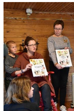
Bērnu rīts Valgas bibliotēkā