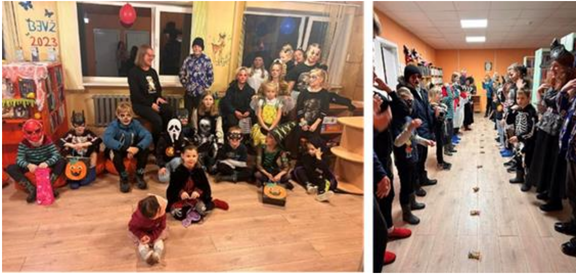
Mošķu stafete Variņu bibliotēkā