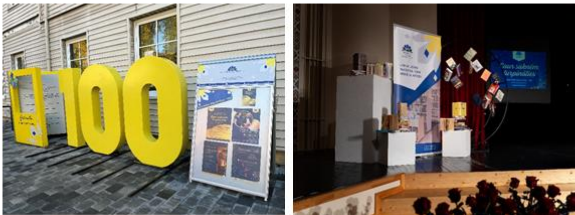
Smiltenes bibliotēkai 100. Pa kreisi: vides objekts. Pa labi: skatuves noformējums sarīkojumā.