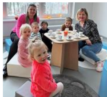
Mazie Ērgemes bibliotēkas apmeklētāji

Ērgemes bibliotēka kopš pārcelšanās uz jaunajām telpām (blakus pamatskolas ēkai) aktivizējusi sadarbību ar skolu un PII. Klašu kolektīvi ir bieži viesi bibliotēkā – atskaites gadā tika organizētas gan mācību stundas bibliotēkas telpās (datubāzu izmantošana un to piedāvātās iespējas, bibliotēkā pieejamie novadpētniecības materiāli), gan pastaiga pa apkārtnes vēsturiskajiem objektiem. PII audzēkņiem vidēji reizi mēnesī tiek veidota tematiska nodarbība ar aktīvu darbošanos un grāmatu priekšlasījumu (Sveču diena, Pavasaris mums apkārt, Māmiņdiena, Advente u.c.).