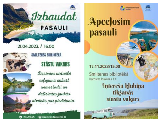
Aicinājums uz interešu klubiņa tikšanos

Par bibliotēkas krājumu regulāri tiek sagatavoti vērtīgāko jaunieguvumu ikmēneša apskati, veidoti grāmatu jaunumu saraksti, kuri ievietoti tīmekļa vietnē. Smiltenes bibliotēkā jaunumu saraksti pieejami arī papīra formātā mapē “Jaunākās grāmatas bibliotēkā”. Ik mēnesi tiek izgatavots plakāts “Jaunākās grāmatas”. Vislielākais pieprasījums ir