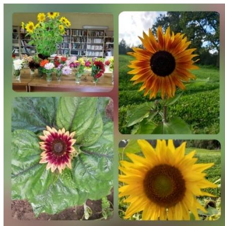
Saulespuķes Lobērgu bibliotēkā

Bilskas bibliotēkas Lobērgu nodaļā atskaites periodā norisinājās 32 dažādas aktivitātes, pasākumi un izstādes. Īpašu iedzīvotāju atsaucību guva saulespuķu audzēšana. Pavasarī, Bibliotēku nedēļas ietvaros, tika uzsākts un vēlāk arī īstenots sociāli emocionāls projekts, kurā iesaistījās bibliotēkas lietotāji. Pavasarī bibliotēkas lietotāji no bibliotēkāres saņēma saulespuķu sēklas, tad tās katrs iesēja savā dārzā un visu vasaru kopa. Rudens sākumā veikums tika iemūžināts fotogrāfijās un tapa virtuālā izstāde. Šis projekts, kā ierasts, neprasīja lielu finansējumu. Gala rezultātā bibliotēkas “ideja uzziedēja” gandrīz visos Lobērgu dārzos, kā apliecinājums, ka maza lauku bibliotēka mūsdienās var darboties arī kā apdzīvotas vietas noskaņas veidotāja un uzturētāja.