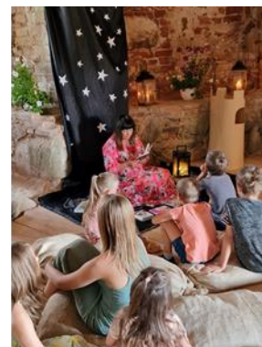
Pasaku lasīšana Ērgemes pilsdrupu tornī pagasta svētku laikā

Ērgemes bibliotēka piedāvā, kā interesanti apskatīt un iepazīt savu dzimto pusi un pagasta vēsturi. Ir organizēts pārgājiens gan dienas laikā, gan naktī ar piedzīvojumiem un uzdevumiem atrast apslēptos dārgumus, apmeklējot Ērgemes pilsdrupas, un pat sastapties ar pils balto dāmu. Ērgemes pagasta 700 gadu jubilejā pils tornā pirmajā stāvā visi apmeklētāji bija aicināti uz radošajām stundām, kur tika lasītas pasakas, spoku stāsti, kā arī dažādas radošas aktivitātes. Šis pasākums bija ļoti apmeklēts.