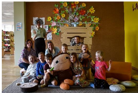
Izstādes "Laipni lūgti uz Alfona Oberga viesībām" apmeklētāji

Vērtīgas un ievērojamiem eksponātiem bagātas ir ceļojošās izstādes. 2023. gadā tās bija divas: arhitektes un grāmatu ilustratores Annas Vaivares ceļojošā ilustrāciju izstāde “Ineses māja” ( TE , TE ) un ceļojošā interaktīvā izstāde “Laipni lūgti uz Alfona Oberga viesībām” ( TE , TE ).