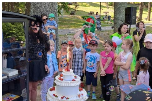
Āra lasītavas gada jubileja “Kukainīt, re, kā saule spīd!”

Smiltenes bibliotēka mērķtiecīgi darbojusies, lai iedzīvinātu āra lasītavu kā visai ģimenei pievilcīgu atpūtas vietu Vecajā parkā un nostiprinātu tās funkciju – mainīties ar grāmatām un žurnāliem, atstāt plauktā izlasītu, bet paņemt lasīšanai sen kārotu iespaiddarbu un palasīt brīvā dabā. Gada siltajā laikā organizēti divi pasākumi, kas piesaistīja ievērojamu skaitu ieinteresētu apmeklētāju.