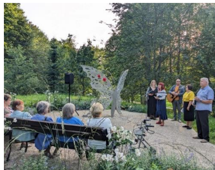
Dzejas dienās Marikas Svīķes kultūrvietā