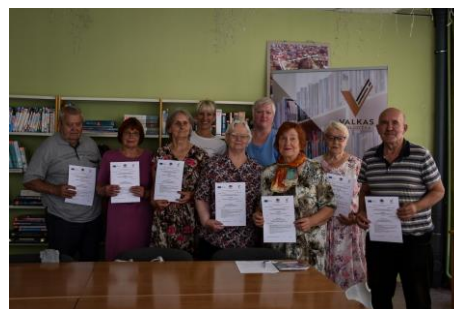
“Digitālo pakalpojumu izmantošana ikdienas dzīves situāciju risināšanā” mācību noslēgums

Valkas bibliotēka 2023. gada jūnijā Eiropas Savienības Erasmus+ programmas projekta “Nacionālie koordinatori Eiropas programmas ieviešanai Latvijas pieaugušo izglītībā” Nr. 10105130 – NCLV – ERASMUS-EDU-2021-AL-AGENDA-IBA ietvaros īstenoja neformālās izglītības programmu “Digitālo pakalpojumu izmantošana ikdienas dzīves situāciju risināšanā” cilvēkiem bez vai ar nelielām priekšzināšanām datoru lietošanas un e-prasmju jomā. Programmas ietvaros astoņi seniori apguva teorētiskas zināšanas par interneta darbības pamatprincipiem, datoru uzbūvi un drošību internetā, bet praktisko nodarbību laikā – darbības ar e-pastu, elektronisko parakstu, rēķinu apmaksu internetbankā, informācijas meklēšanu internetā.