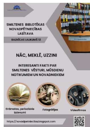
Infografika. Novadpētniecības lasītava

Arī Bilskas bibliotēkas Lobērgu nodaļā tiek vāktas rokraksta liecības. Tie ir dažādi atmiņu stāsti no vietējiem iedzīvotājiem ar spilgtākajām atmiņām par dzīvi Lobērgos dažādos laikos. Vērtība ir gan šie dažādie rokraksti, gan pašas liecības. Nākotnē plānots savākt pēc iespējas vairāk stāstu, lai izveidotu izstādi un materiālus digitalizētu.