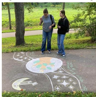
Asfalta zīmējumu izstāde “Dzeja iedvesmo”

mapei, kurā izveidoti apraksti par konkrēto jaunieguvumu. Čaklākie grāmatu lasītāji ar nepacietību katru mēnesi gaida “Jauno grāmatu dienu” un mapi, kurā var apskatīties visas jaunākās grāmatas un iestāties rindā uz sev tīkamo grāmatu, ja tā dotajā brīdī ir izsniegta.