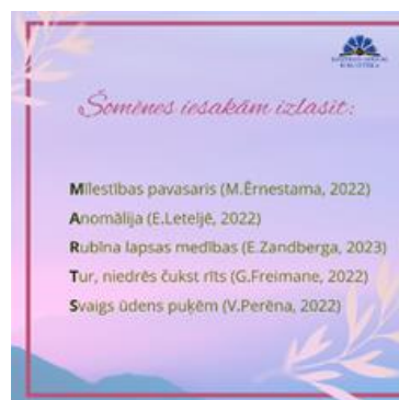
Grāmatu ieteikums marta mēnesī

Raunas bibliotēka uzsver, ka lietotājus uzrunā pasākumi un izstādes, kas saistās ar kaut ko personisku vai viņa interesēm atbilstošu. Par šādiem pasākumiem vienmēr ir liela interese un tie ir ļoti kupli apmeklēti. Bibliotēku veiksmīgi popularizējošie pasākumi ir jauno grāmatu izstādes, tikšanās ar grāmatu autoriem, izstādes bibliotēkas telpās un pasaku rīti sestdienās visai ģimenei. Kā viens no visveiksmīgākajiem šī gada pasākumiem ir Lasītāju