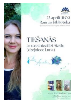
Raunas bibliotēkas simtgades publicitātes materiāli