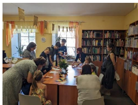
Radošā darbošanās “Celies spārnos”

Bibliotēkas telpās apmeklētājiem tika piedāvāta iespēja gan aplūkot izstādes, gan piedalīties ģimeņu radošajā nodarbē “Celies spārnos”, gan fotografēties kopā ar Loti.