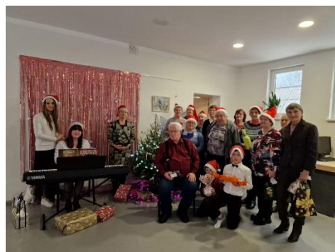
Ziemassvētki Ērgemes bibliotēkā