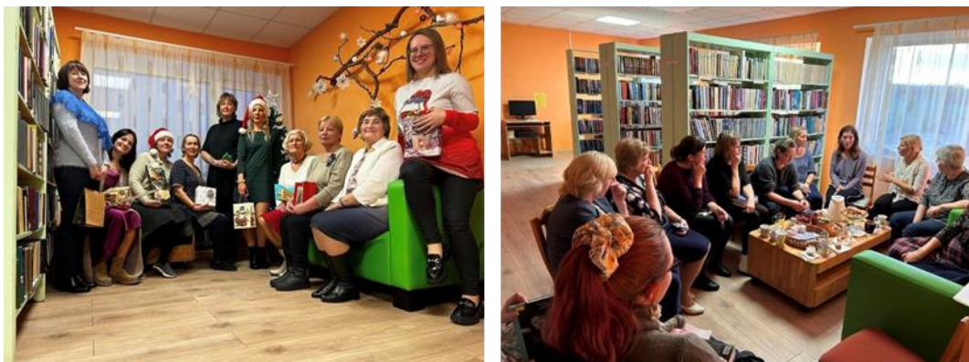
Lasītāju klubiņš Variņu bibliotēkā

Rudenī Variņu bibliotēkā tika izveidots “Lasītāja klubiņš”, kurš guvis ļoti lielu atsaucību. Šobrīd klubiņā ir 16 dalībnieki – gan vīrieši, gan sievietes. Reizi mēnesī tiek rīkotas tikšanās, kuru laikā dalībnieki dalās savās pārdomās par izlasīto. Notiek savstarpēja domu un literatūras apmaiņa, kā arī tiek rīkotas meistarklases, tikšanās ar rakstniekiem, dažādi tematiskie pasākumi.