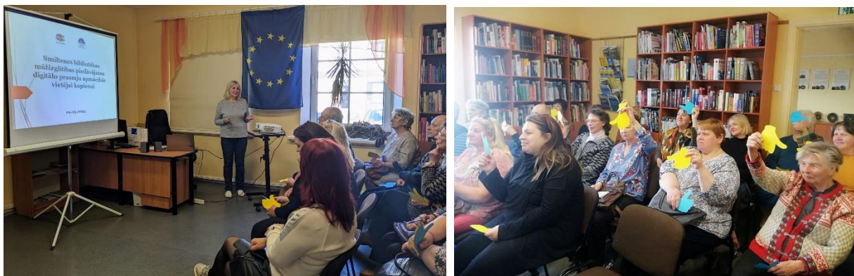
Eiropas dienas pasākums Smiltenes bibliotēkā

Eiropas Komisija jau desmit gadus izvēlas kādu tematu, kam nepieciešama īpaša uzmanība un rīcība. Eiropas Savienībā liela problēma ir digitālo prasmju trūkums, tāpēc 2023. gads bija pasludināts par “Eiropas Prasmju gadu”. Cilvēki, kam piemīt vajadzīgās digitālās prasmes, spēj sekmīgāk pielāgoties pārmaiņām ne tikai darba tirgū, bet arī pilnā apjomā iesaistīties pilsoniskajā sabiedrībā un demokrātiskajos procesos. Mūžizglītības jaunākie izaicinājumi un aktualitātes tieši saistās ar digitālo prasmju apgūšanu.