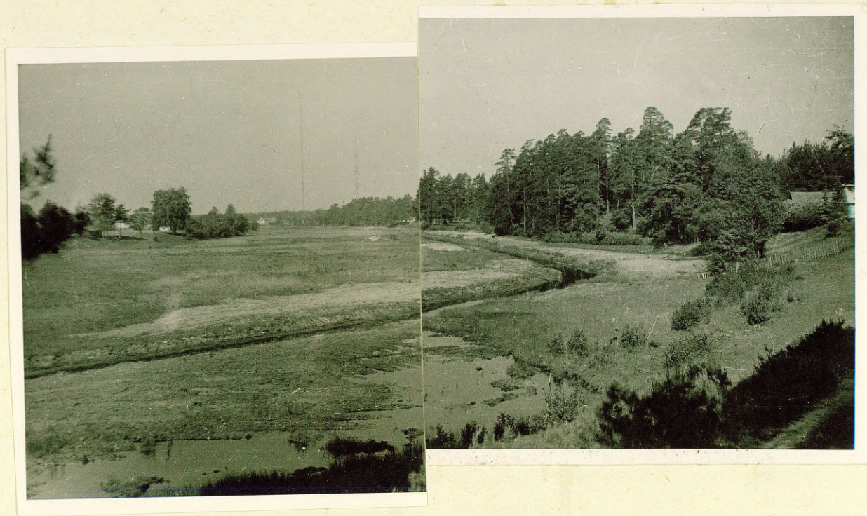
Фото № 13 Древняя долина р. пре-Даугавы у пос. Ульброка.