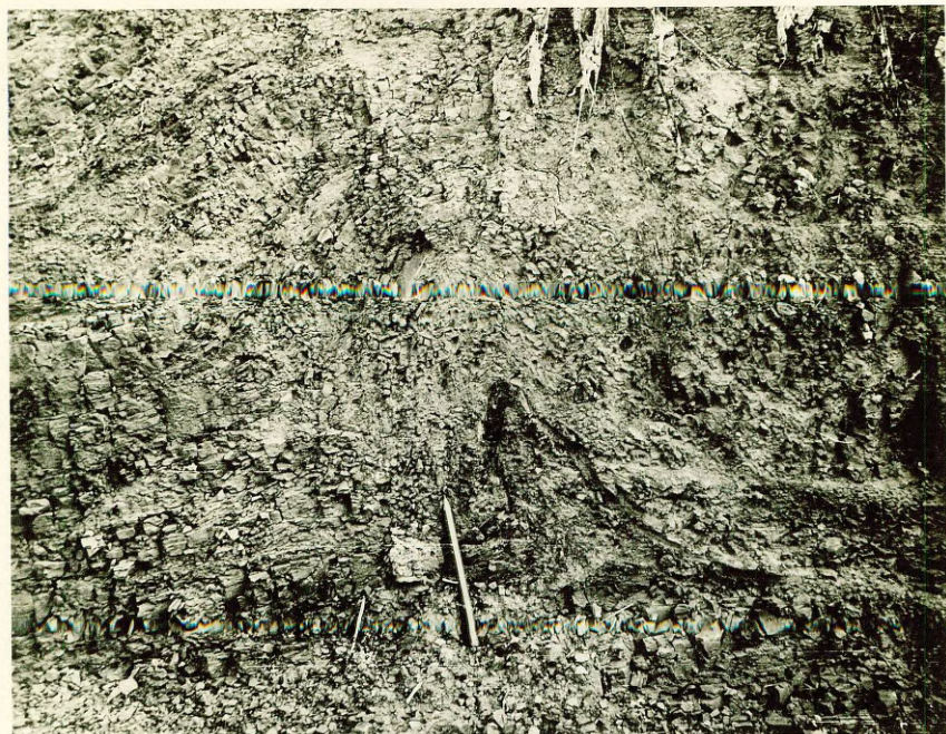
Фото № 5 Левый берег р.Б.Юглы у хут.Битениеки.

Микроскладка в пестроцветных глинах саласпилской свиты (ширина 10см, высота 12см)