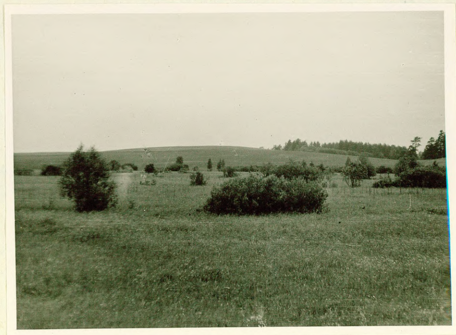
Фото № 11 Холмисто-моренное плато в районе хут. Добелниекс.