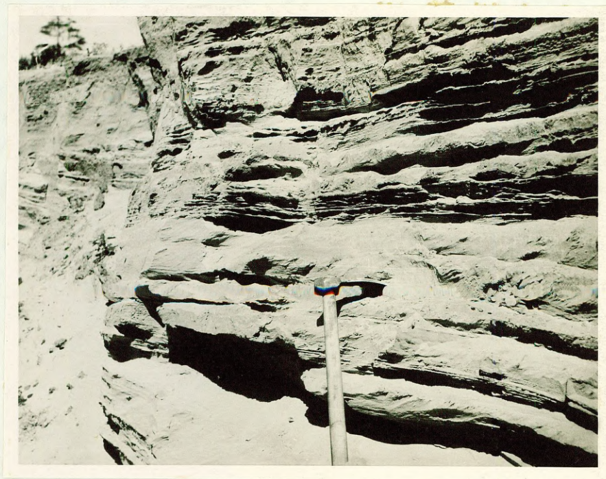
Фото №9 Тонкозернистые пески Балтийского ледникового озера с ожелезненными прослоями. Обнажение № 127, у хут. Смени.