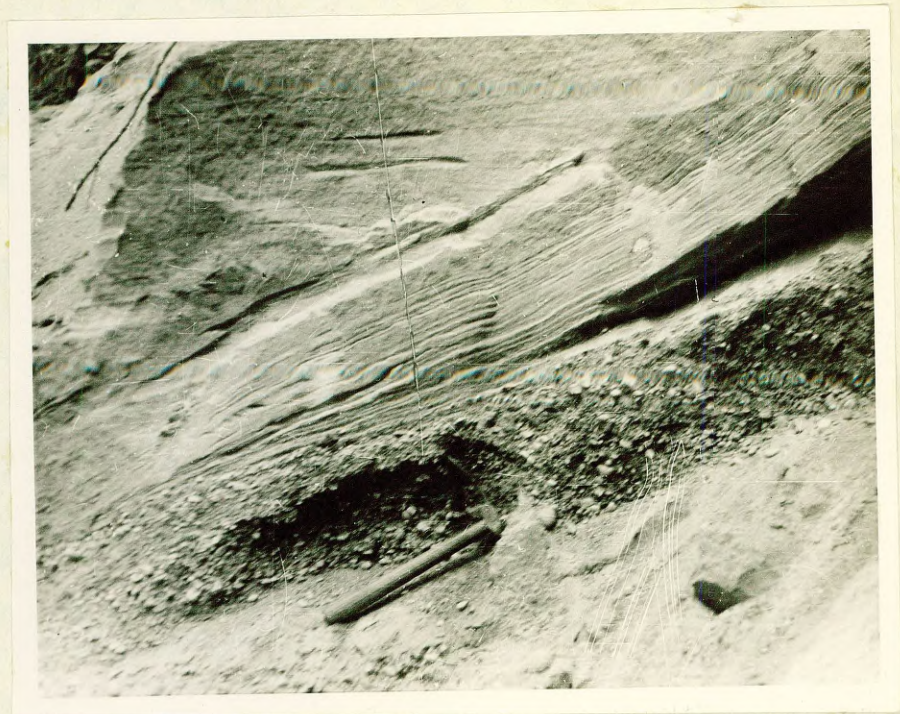
Фото № 7 Слоистые флювиогляциальные отложения оза Огрес Кангари в районе ст. Циемупе. Обнажение № 486 ( хут. Калеи )