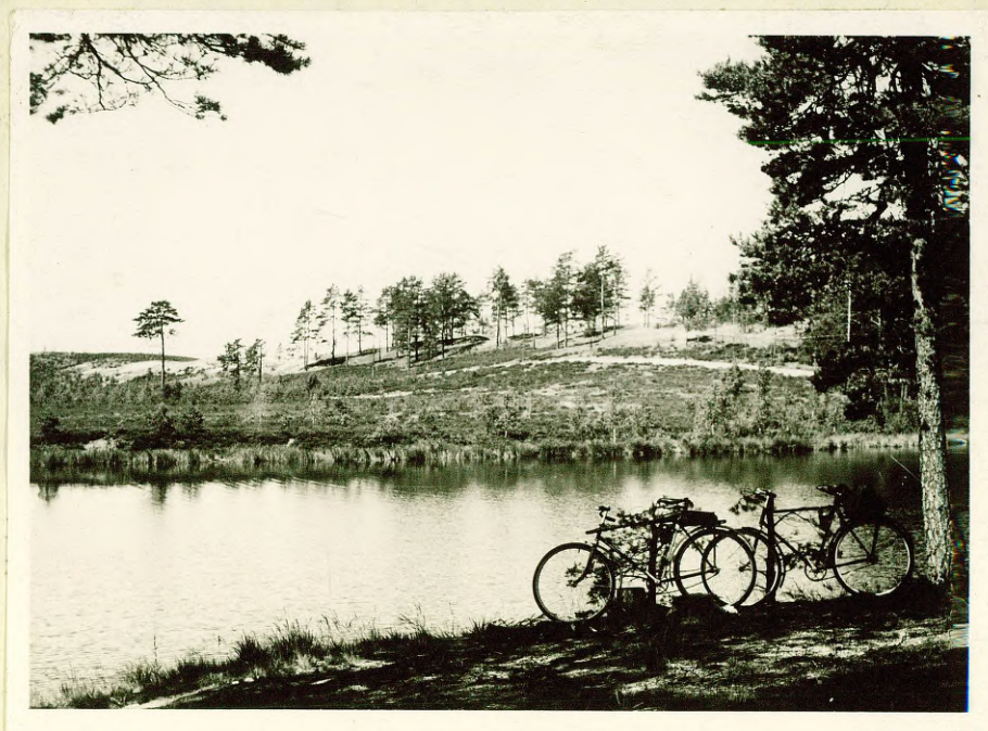
Фото № 3 Озеро Буллю ( к востоку от ст.Ропяжи ).

Озера встречаются и в области ледниковой аккумуляции, напр., оз.Селекю, оз. оз.Лилию и др., но они значительно меньше по размерам.