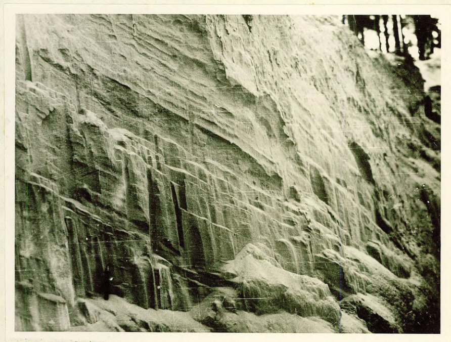
Фото № 8. Слоистость в мелкозернистых песках Балтийского ледникового озера. Обнажение № 110, к востоку от оз. Венчу.