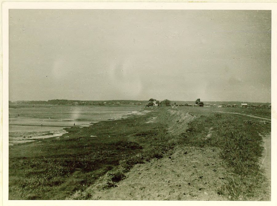
Фото № 14 Уступ I-й надпойменной террасы р. Даугава у Марушка.

Вторая надпойменная терраса ниже Кегумской плотины тянется с перерывами до ст. Саулкялине, ее высота над уровнем реки 11 м, абсолютная высота у хут. Дипши н +18 м. В своем нижнем течении р. Даугава пересекает область абразионно-аккумулятивной деятельности различных стадий Балтийского бассейна. Ниже ст. Селаспиле резко уменьшается глубина долины (7-8 м), коренные берега поднимаются очень полого. На этом участке р. Даугава имеет только пойму и I надпойменную террасу высотой до 7 м над рекой (абс. выс. 4,0-9,5 м), надпойменная терраса прослеживается до границ г. Риги (см. фото № 14). Сложена надпойменная терраса галечниками, а ее цоколь доломитами (обн. № 350). На поверхности террасы местами прослеживаются ложбины старых русел, напр., к северо-востоку от пос. Марушка. В окрестностях ст. Селаспиле в русле реки много небольших порогов (см. фото № 15).