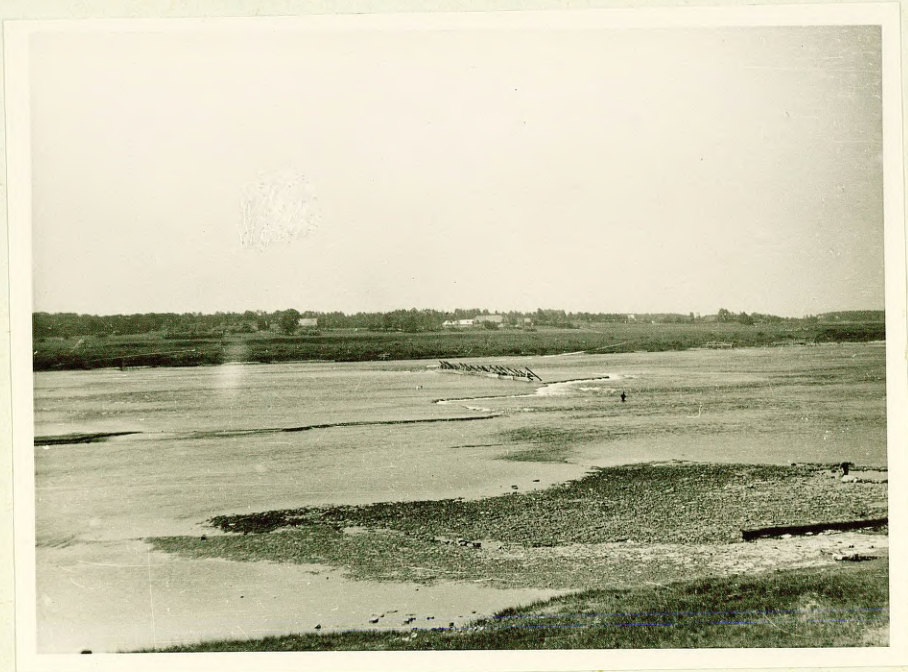
Фото № 15 Пороги на р. Даугаве у Мэрушки, обусловленные уступом в даугавских доломитах.

Исследуемую территорию пересекает еще одна крупная река нашей республики — р. Гауя, правда, тоже только в своем низшем течении. Характер долины р. Гауя резко различается в низшем течении и на участке выше пос. Инчукалнс. От г. Сигулда до пос. Инчукалнс Гауя течет по древней долине, которая описана уже выше, борте долины сильно изрезаны оврагами, что свидетельствует о сильной эрозии в прошлом. Развитию оврагов здесь способствовало широкое распространение рыхлых девонских песчаников.