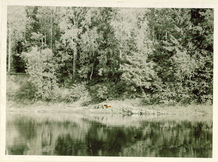
Фото № 10 Структура в доломитах даугавской свиты на левом берегу р.Огре