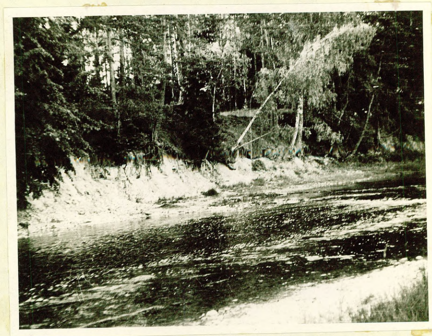
Фото № 4 Обнажение доломитов саласпилской свиты на правом берегу р.Б.Юглы у Баяркрогс.

На остальной территории эти отложения вскрыты большим количеством скважин, особенно много скважин пробурено при разведке Сауриешского и Саласпилского гипсовых месторождений и при исследованиях в районе курорта Кемери. Местами отложения саласпилской свиты сильно дислоцированы и носят следы перематия, напр., в обнажении № 162 на берегу р. Б.Юглы (см. фото № 5)