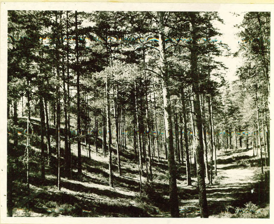
Фото № 1 Дюнный массив к северо-западу от хут. Бривкалны ( у шоссе Ропажы - Малпилс )