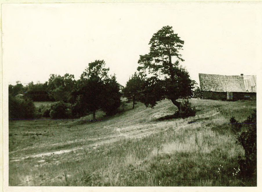
Фото № 16. Уступ коренного берега к пойме р. Б. Юглы у Нагломуйжа.

Б. Югла местами имеет хорошо выраженную долину, четко выделяется пойма и надпойменная терраса, напр., ниже Закюмуйжа, у хут. Нагломуйжа (см. фото № 16). Долина реки обычно широкая, у сельсовета Берги она достигает 1 км. Надпойменная терраса р. Б. Югла на участке между хут. Суньши и хут. Муцениски имеет высоту около 2 м. Выше Закюмуйжа долина становится уже, ее берега прорезаны в верхнедевонских доломитах, берега крутые, в русле тоже обнажаются доломиты.