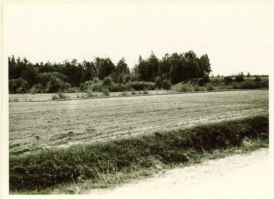
Фото № 12 Уступ останца Бялтайского ледникового озера низменности Литориновой лагуны в районе оз. Атару.