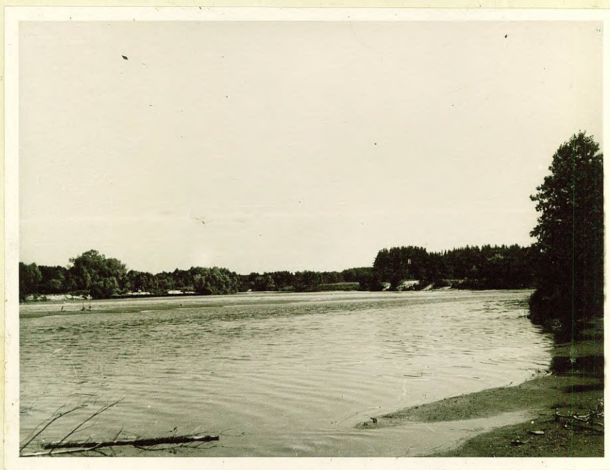
Фото № 2 Река Гауя у хут. Кажоки.