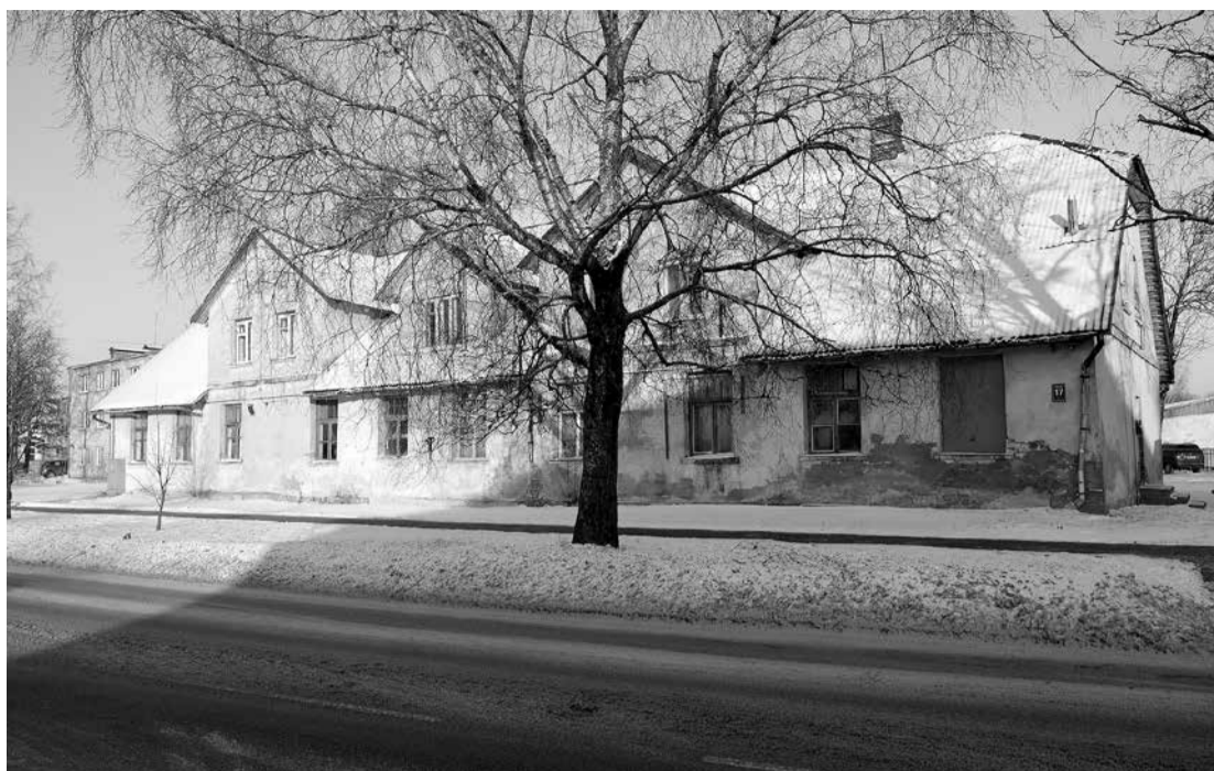
Ēka Cēsu ielā 17, Limbažos