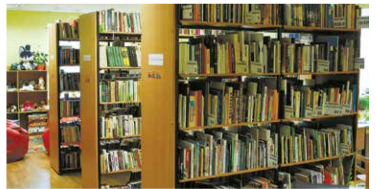
Pagastā ir divas labiekārtotas publiskās bibliotēkas – Lādē un Lādezerā, kā arī viena privātā bibliotēka – Stūrīšos.

Uzņēmējdarbības jomā attīstīti ir trīs t.s. konceptmāju ražošanas uzņēmumi, kuri pārsvarā strādā eksportam un ir arī lielākie pagastā: „VIT būve”, „Superbebris” un „Ekla”. Pašvaldības funkcijās ietilpst uzņēmējdarbības atbalsts, nodrošinot infrastruktūru – ceļus. Šobrīd ar ES finansiālu atbalstu „VIT būve” gatavojas celt jaunu angāru, bet pašvaldi-