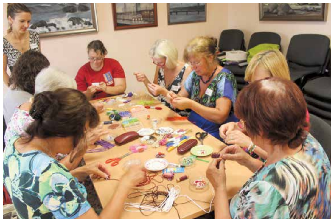
Sabiedriskais centrs „Lādes Vītoli” piedāvā dažādas radošās darbnīcas, kopāsanāksanas un apmācības. Tostarp – lielu popularitāti iemantojušas adīšanas nodarbības, pulcējot krietnu pagasta sieviešu pulciņu.