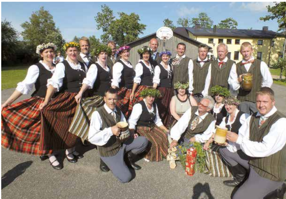
Viens no jaukākiem pasākumiem ir lēģošanas pasākums visās piecās pagasta apdzīvotās vietās. Un tur neiztikt bez deju kopas „Lādezers” dejotājiem.