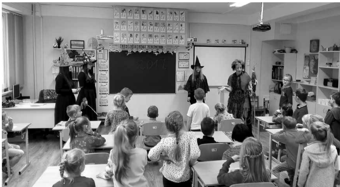
Topošie pirmklasnieki ar labajām raganiņām dodas ceļojumā mūzikas, mākslas un teātra pasaulē.

Janvāra vidū topošie pirmklasnieki īpaši kuplā skaitā bija sapulcējušies, lai dotos kārtējā ceļojumā – šoreiz mūzikas, mākslas un teātra pasaulē. Bērnu ceļojumā pavadīja labās raganiņas, kuras savas Virsraganas vadībā mācījās ieburties tajā brīnumu pasaulē, kura mīt aiz katrām durvīm skolā.