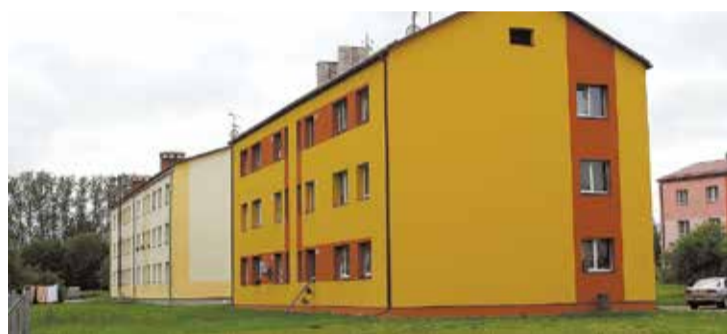
Ozolaini, kas ir viens no diviem lielākajiem ciematiem pagastā, var dēvēt par siltāko apdzīvoto vietu valstī – šeit nosiltinātas visas 10 daudzdzīvokļu mājas.

„Mums noteikti ir, ko piedāvāt gan savējiem, gan viesiem,”