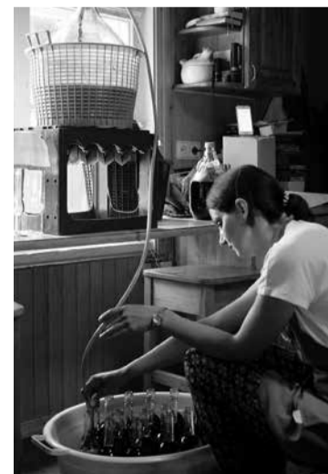
„Jokas” vīnu darīšanas process ir gana komplicēts, un kaut arī viņam dots mājas vīnu statuss, tas vairāk atgādina kādas kārtīgas franču vīna darītavas darbu.