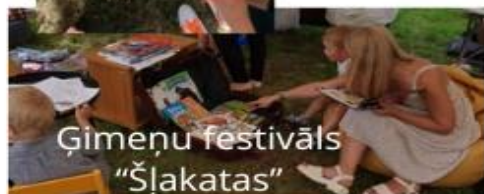
Ģimeņu festivāls “Šlakatas” Rožupes bibliotēka