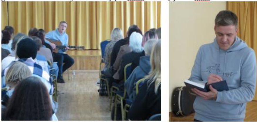
Pasākumā piedalījās 79 dalībnieki – visu vecuma grupu Kārļa Kazāka talanta cienītāji.