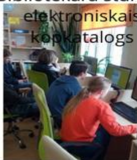
Bibliotēkā stunda- elektroniskais kopkatalogs