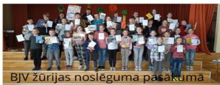
BJV žūrijas noslēguma pasākumā Rudzātu bibliotēka