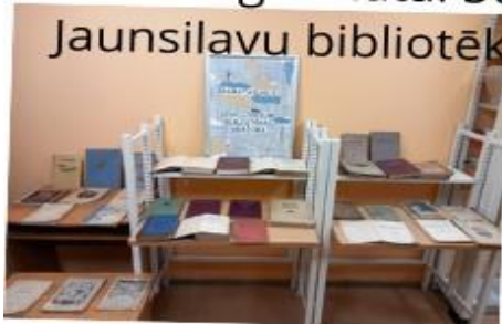
“Latviešu grāmatai 500”. Jaunsilavu bibliotēkā