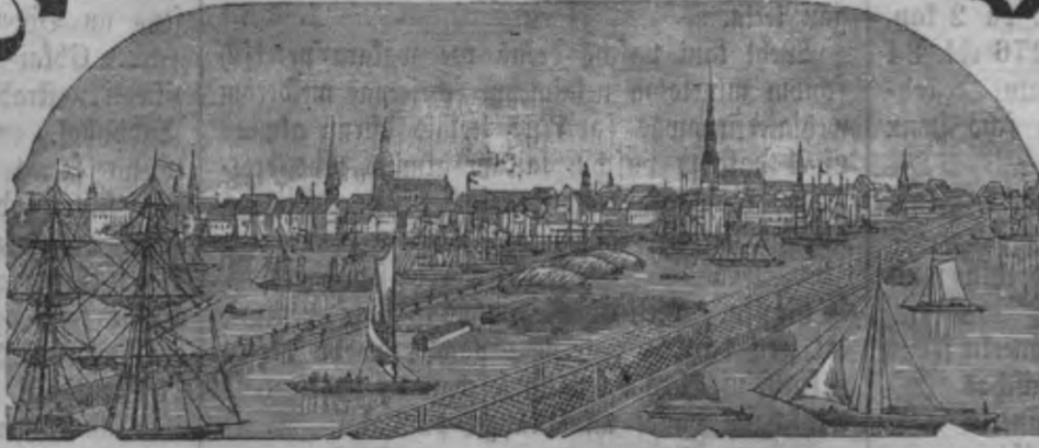
Mahjas Weefis isnahk weentēis pa nedekū.

Mafsa ar peesubtiščam Rīgā: Ar Beelikumu: par gadu 1 r. 75 l. Ar Beelikuma: par gadu 1 " " " Ar Beelikumu: par 1/2 gadu " 90 " Ar Beelikuma: par 1/2 gadu " 55 "