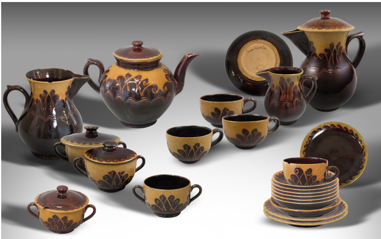
Jāņa Krieva darbnīcā darināti keramikas trauki. 1930.-45. gads. TMNM 6997, 23043, 11537, 11538, 6422, 8464, 12411/2, 7007/1,2, 41382/1-8, 9-19, 22, 23, 29, 30