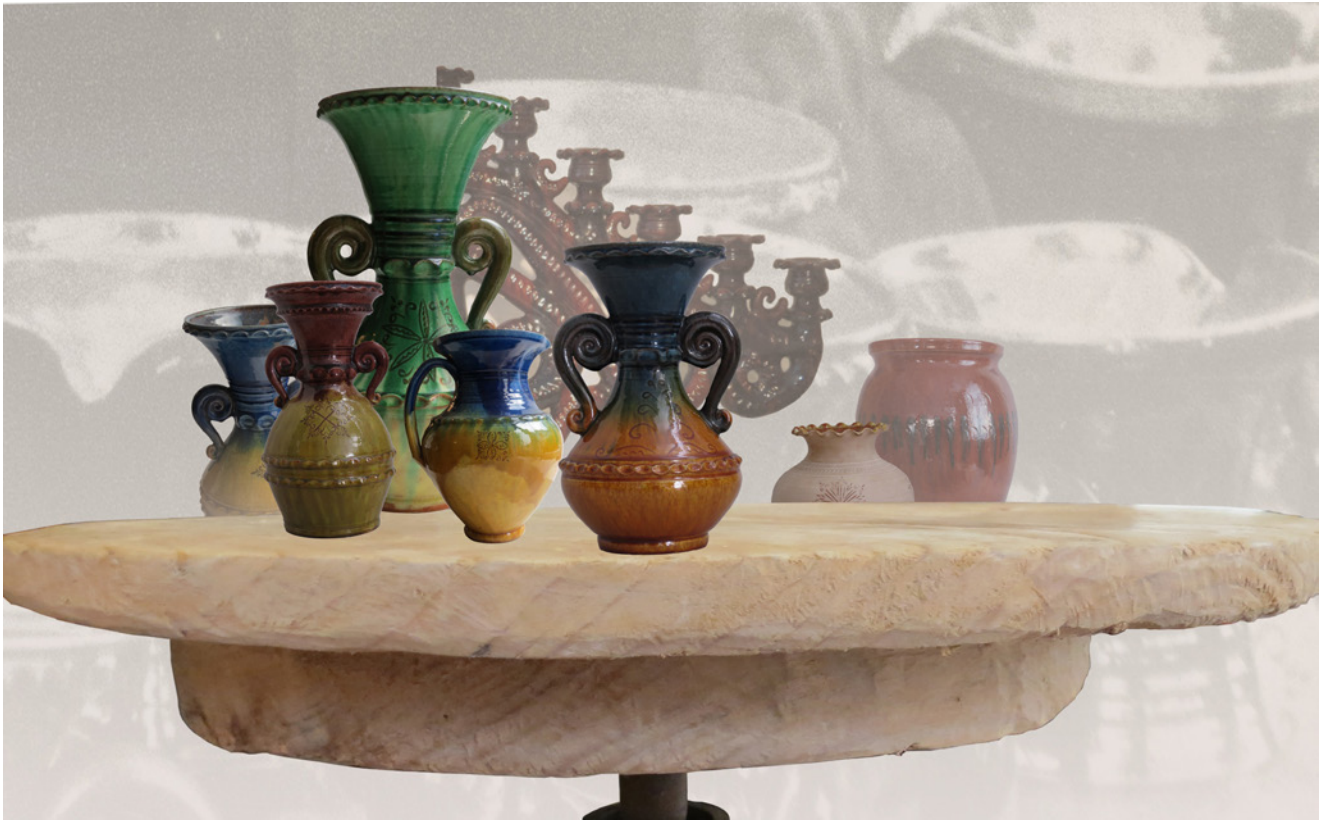
Polikarpa Čerņavska keramika. Silvijas Berezovskas fotomontāža uz meistara ripas. 2013. gads. Preiļu vēstures un lietišķās mākslas muzeja krājums