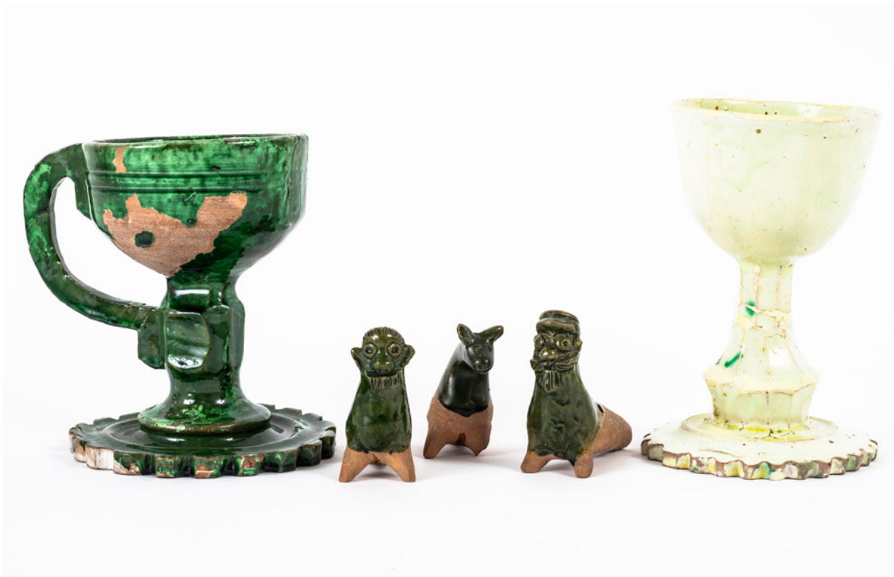
Cukurtrauki un māla svilpītes. Autors: Jānis Melngalvis (Melgalvis), Kuldīgas apriņķa Kursīšu pagasta "Dūmiķos". 20. gs. sākums. Fotogrāfs: Jānis Puķītis. Latvijas Nacionālā vēstures muzeja krājums