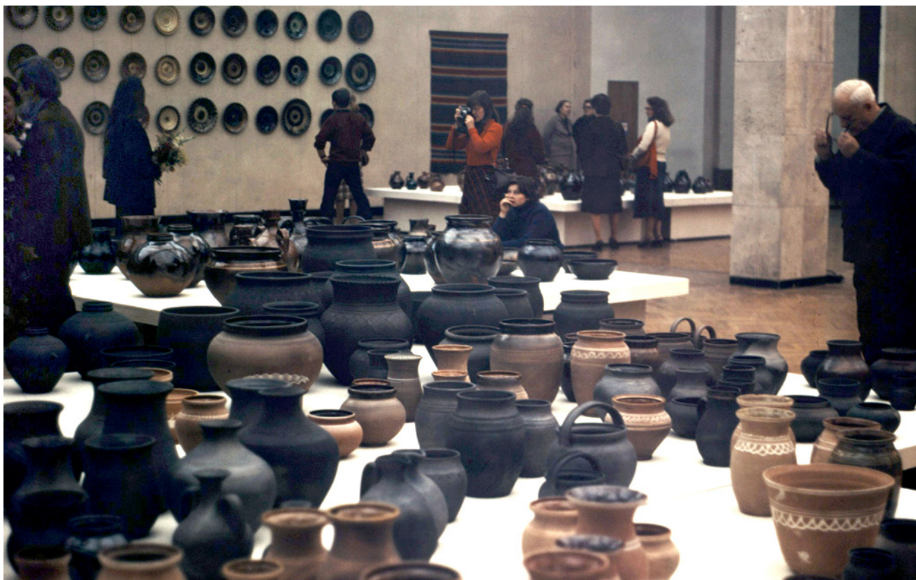
Latgales keramikas ekspozīcija Maskavā. 1982. gads.