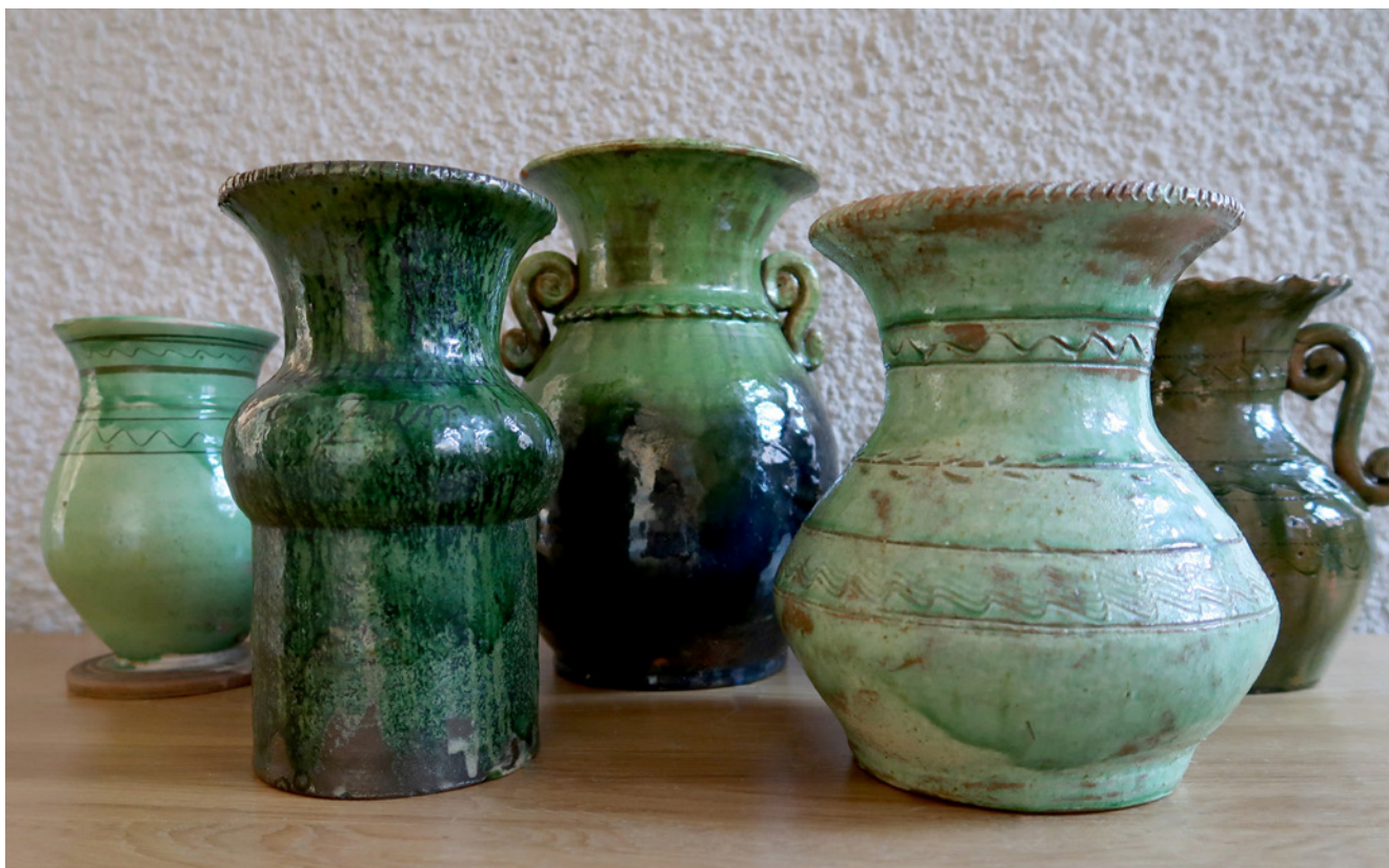
Silajāņu keramika no Oskara Kalēja kolekcijas. 1930. gads. Fotografārs: Juzefa Unzule. Daugavpils Novadpētniecības un mākslas muzeja krājums. DNMM 1437, 1439, 8751, 8868, 1930