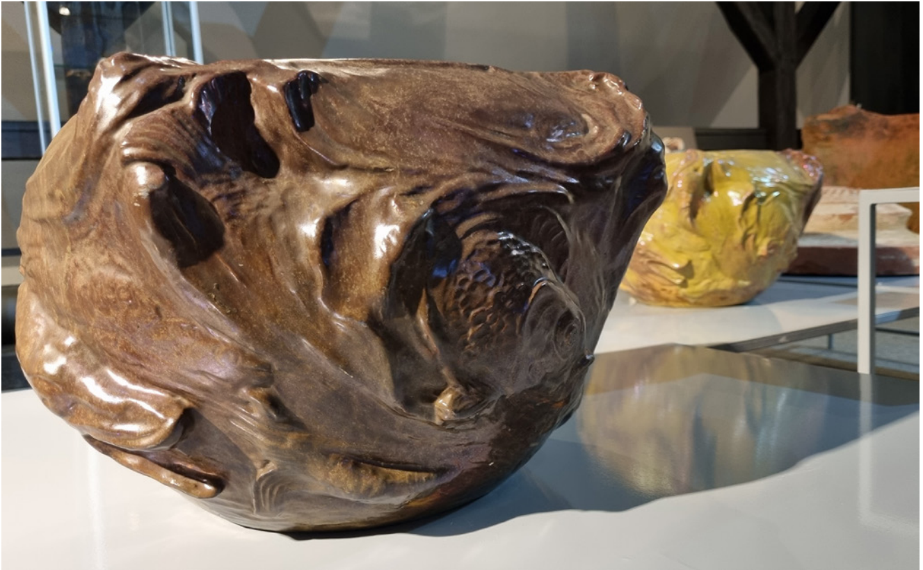
Augusta Jullas darināta vāze. 1912. gads. Cēsu Vēstures un mākslas muzejs. CM 17239