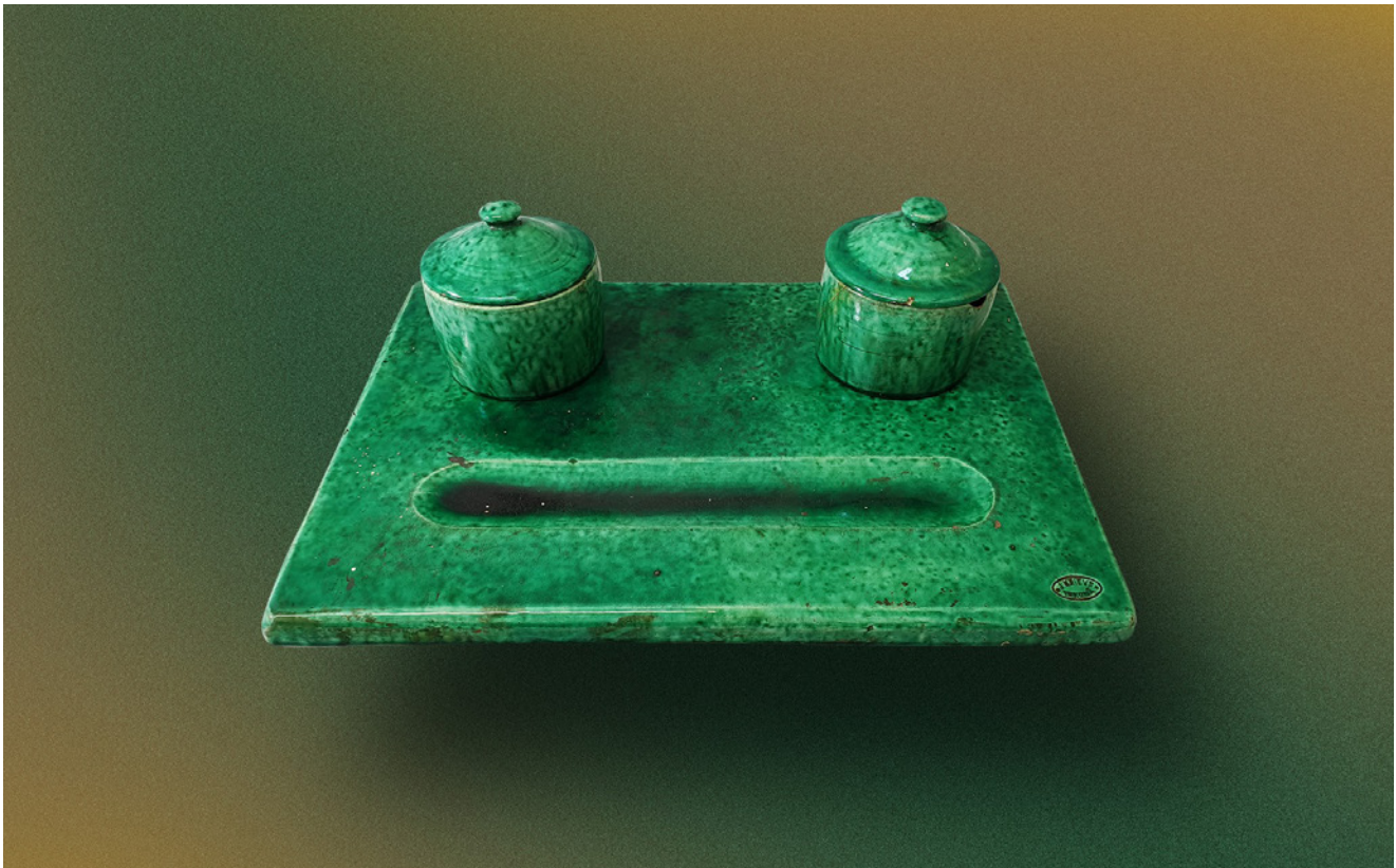
Jāņa Krieva podniecībā darināta tintnīca, ko lietojis pats meistars. 1933.–1945. gads. Fotografā: Līva Lielmane (precējusies Rācenāja). Tukuma muzeja krājums. TMNM 11501