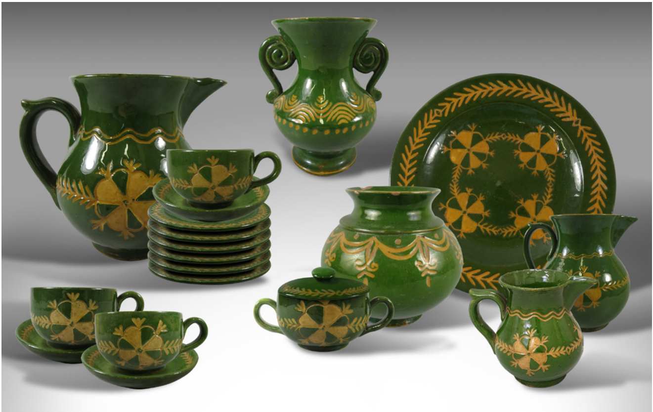
Jāņa Krieva darbnīcā pēc 1933. gada darināti keramikas trauki. Tukuma muzeja krājums. TMNM 42431–42438, 12520,11536, 23054/5