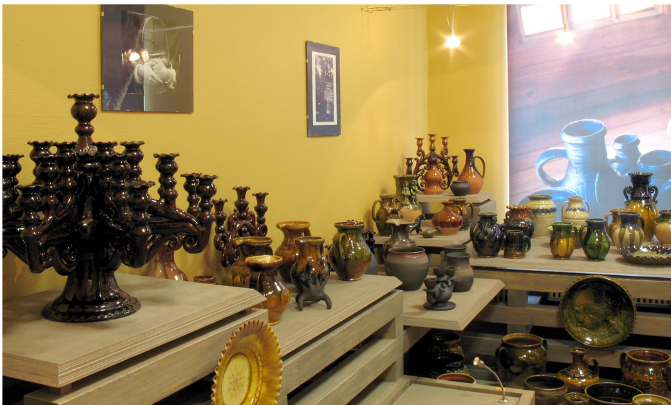
Latgales Kultūrvēstures muzeja ekspozīcija "Māla un uguns pārvērtību radīts brīnums".