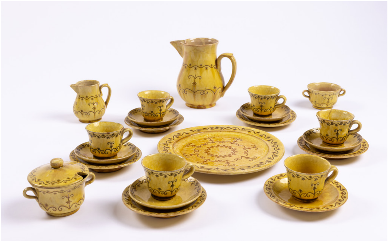
Jāņa Krieva keramikas darbnīcā tapusī kafijas servīze. Fotografāfs: Gatis Dieziņš, Latvijas Etnogrāfiskā brīvdabas muzeja krājums. BDM 6357: 1–23