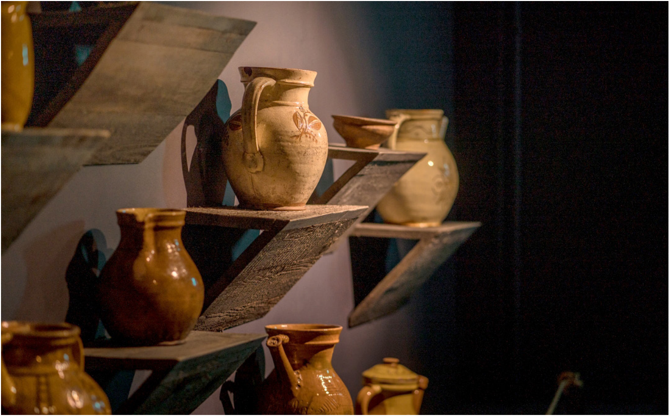
Rucavas krūzes. Fotografā: Kārlis Volkovskis. Liepājas muzeja krājums