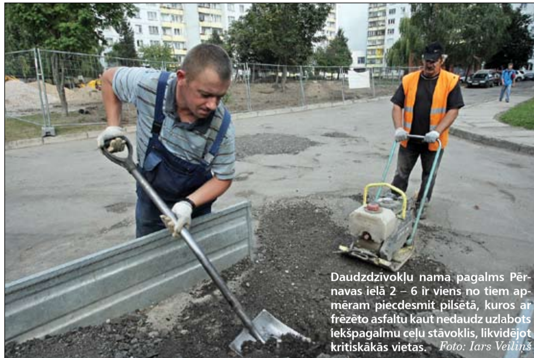
Daudzdzīvokļu nama pagalmā Pērnavas ielā 2 – 6 ir viens no tiem apmēram piecdesmit pilsētā, kuros ar frēzēto asfaltu kaut nedaudz uzlabots iekšpagalmu ceļu stāvoklis, likvidējot kritiskākās vietas.