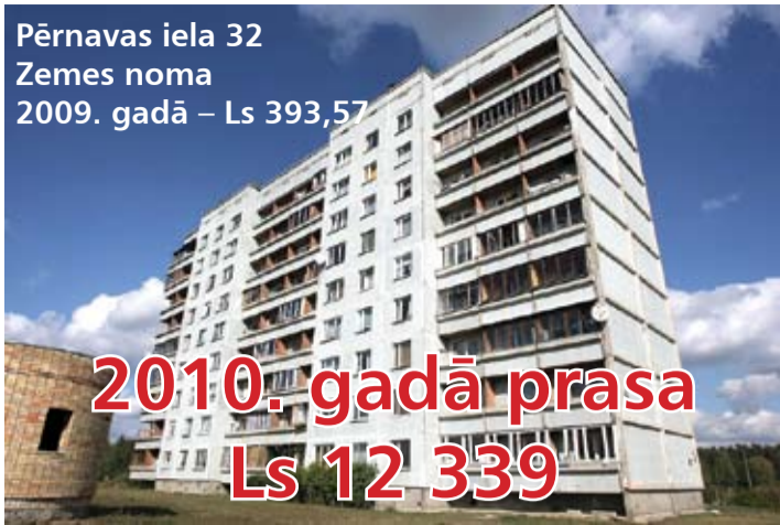
Pērnavas iela 32 Zemes noma 2009. gadā – Ls 393,57