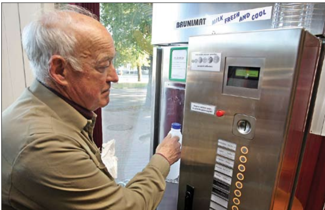
Nu jau nedēļu jelgavniekiem ir iespēja pienu tieši no vietējiem zemniekiem iegādāties pilsētā izvietotajos piena automātos.

«Nemot vērā, ka paši esam piena cienītāji, ļoti labi redzējam nepilnības svaigpiena tirdzniecī-