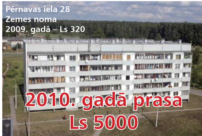
Pērnavas iela 28 Zemes noma 2009. gadā – Ls 320