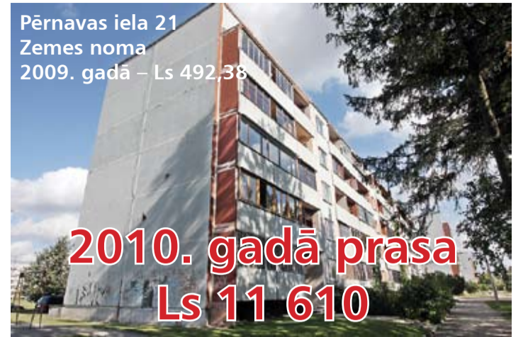
Pērnavas iela 21 Zemes noma 2009. gadā – Ls 492,38