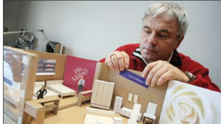
Tāds izskatīsies «Nakts mēbeļu» salons Sanktpēterburgā, kas durvis vērš jau 7. novembrī.