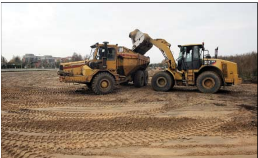
Lai gan šobrīd vecā BMX trase ir demontēta, jau nākamā gada vasarā te gozēsies pavisam jauna un moderna riteņbraucēju «arēna». Šoruden vēl tiks ierīkota drenāžas sistēma un uzbērtā pamatne, bet pavasarī trase iegūs savu formu.