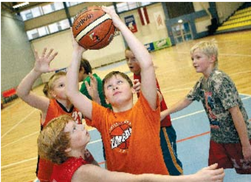
Basketbols ir viens no populārākajiem sporta veidiem Jelgavā. To apliecina fakts, ka Bērnu un jaunatnes sporta skolā šobrīd trenējas vairāk nekā 200 basketbolisti, kuri regulārajā sezonā piedalās sacensībās un turnīros, bet vasarā labprāt uzspēlē, piemēram, kādā strībola turnīrā.

Šobrīd BJSS trenējas 210 basketbolisti – 130 puīši un 80 meitenes.