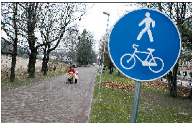
Rekonstruēto ielu priekšrocības var novērtēt ne tikai autovadītāji, bet arī gājēji, jo atjaunotas arī ietves. Pārlielupē rekonstruēti arī 210 metrus garais Strazdu ielas gājēju posms.

«Līdzīga prakse tiks pielietota, ar Eiropas Savienības atbalstu sakārtojot arī citas ielas, un jau pašlaik tiek apzinātas tās, kas būtu jāsakārto, pirms uzsākt Dobeles šosejas rekonstrukciju no Atmodas ielas līdz tiltam pār Svēti,» tā A.Baļčūns, ieskicējot, ka, realizējot šo projektu, ielas segumu, visticamāk, sakārtos 1., 2., 3., 4. un 6. līnijā, Nameju ielā un Bumbieru ceļā.