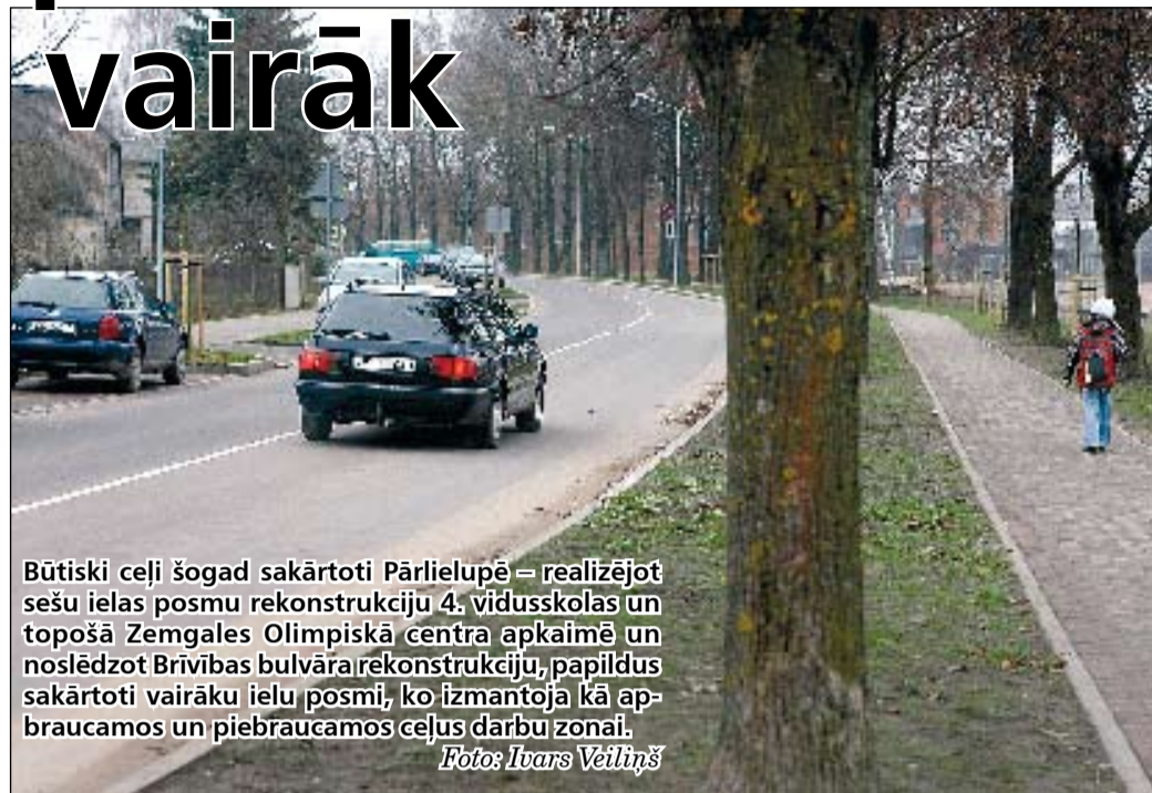
Būtiski ceļi šogad sakārtoti Pārlielupē – realizējot sešu ielas posmu rekonstrukciju 4. vidusskolas un topošā Zemgales Olimpiskā centra apkaimē un noslēdzot Brīvības bulvāra rekonstrukciju, papildus sakārtoti vairāku ielu posmi, ko izmantoja kā apbraucamos un piebraucamos ceļus darbu zonai.

izmaksas un darbu tempu, tika ieviestas korekcijas, šo ielu posmu rekonstrukciju veicot visā garumā vienlaikus. Un jau šajā