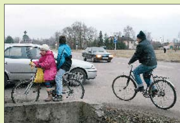
Piesaistot Eiropas fondu līdzekļus, jau pavasarī varētu sākties Filozofu un Dambja ielas krustojuma ar Rūpniecības ielu sakārtošanu. Šis posms gan no autovadītāju, gan gājēju viedokļa pašlaik ir viens no bīstamākajiem mūsu pilsētā.

Tuvāko divu trīs gadu laikā jāuzsāk arī Dobeles šosejas rekonstrukcija no Atmodas ielas līdz pilsētas robežai, savukārt jau pavasarī varētu sākties Filozofu un Dambja ielas krustojuma ar Rūpniecības ielu sakārtošana. «Būvniecības izmaksu samazinājums mums ļauj paveikt krietni vairāk darbu, nekā sākotnēji bijām cerējuši, un šī izdevība mums neapšaubāmi jāizmanto, piemēram, tranzītielu