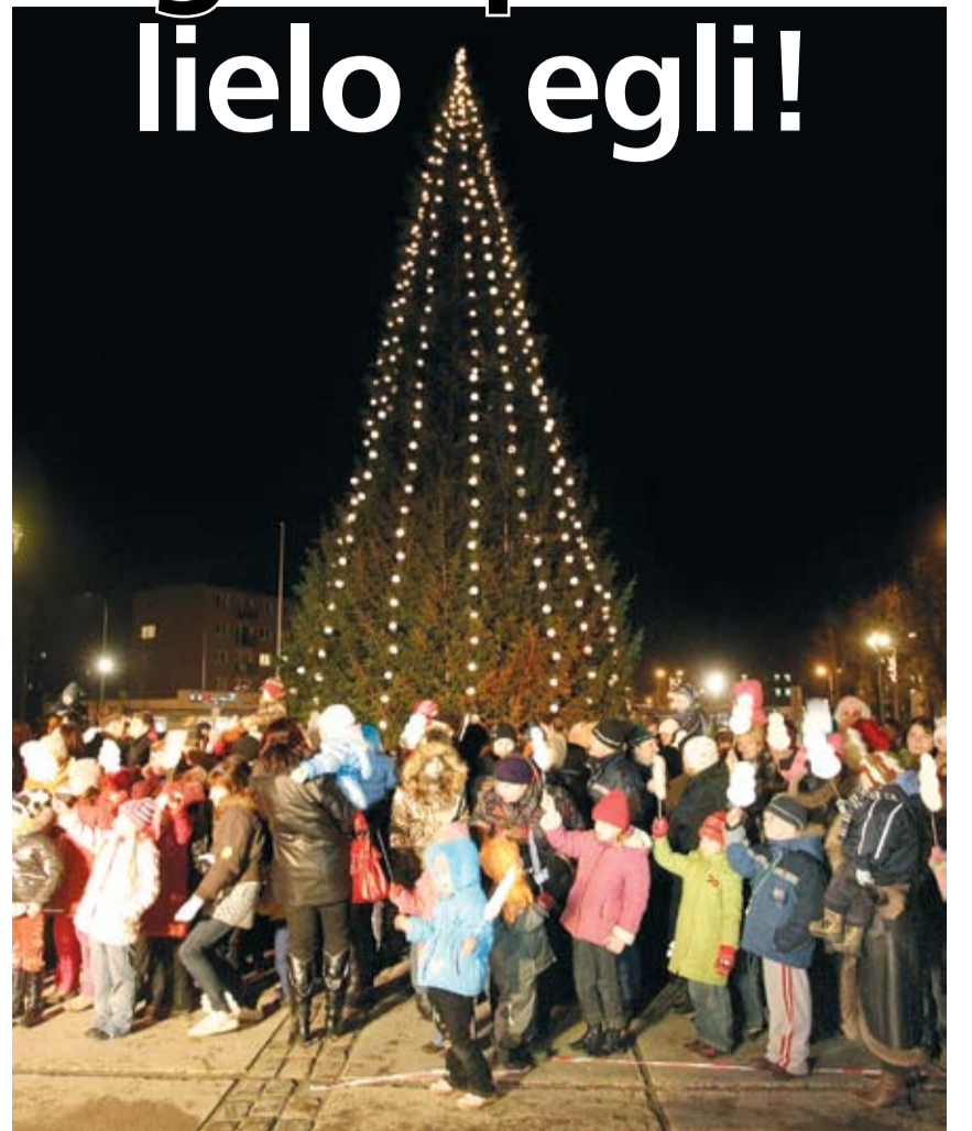
1. decembrī pulksten 17 Hercoga Jēkaba laukumā uz svinīgu pilsētas lielās egles iedegšanu aicināts ikviens jelgavnieks.