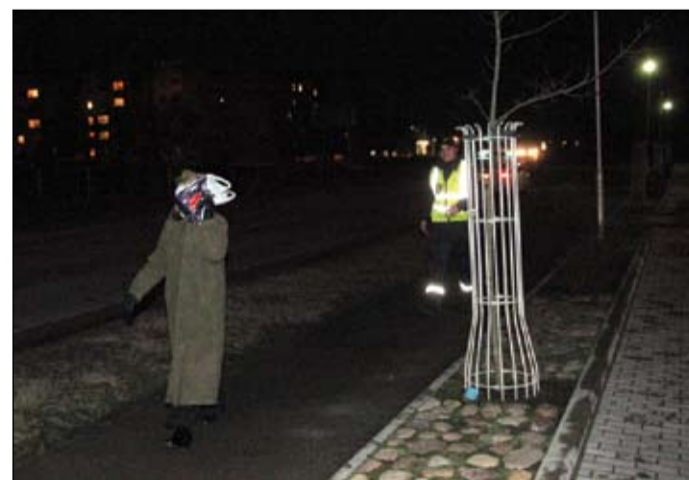
Kamēr policists devās uz mašīnu pēc atstarotāja, sievietē metās bēgt. Policijas inspektori stāsta, ka dažreiz gājēji pat slēpjas grāvjos, tādējādi cerot izvairīties no atbildības.

Ne visi Jelgavas ielās sastaptie gājēji apzinīgi izturas pret savu drošību un diennakts tumšajā laikā lieto atstarotājus. Tomēr ir daži, kas īpaši parūpējas pat par mazāk aizsargātajiem.