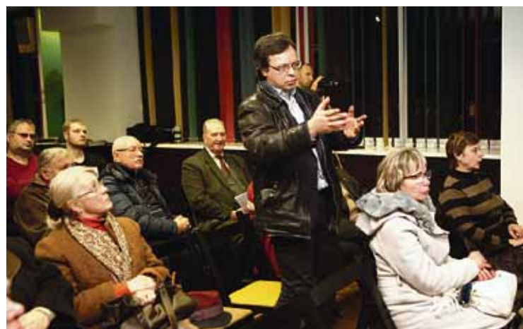
Iedzīvotāju sapulce izstāžu centrā „Rāmava”.

Pašvaldības speciālisti ir apkopējuši iedzīvotāju norādītās problēmas, noteikuši nepieciešamo rīcību un atbildīgo darbinieku jautājuma risināšanai. Tās lietas, kuras bija iespējams atrisināt operatīvi, ir jau paveiktas, piemēram, ielas apgaismojuma problēmas Pļavniekkalna ielā,