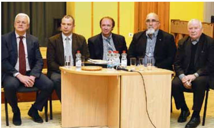
Uz iedzīvotāju jautājumiem atbildēja domes vadība un pašvaldības speciālisti.

novērsti trūkumi daudzdzīvokļu mājas kāpņu telpā Valdlaučos. Tāpat ir sagatavotas vēstules uzņēmumam „Latvijas Valsts ceļi” par vairākiem jautājumiem, piemēram, par to, ka nepieciešams uzlabot apgaismojumu uz gājēju pārejas Bauskas ielā, izveidot gājēju celiņu gar autoceļu V2 (no uzņēmuma „Sanitex” līdz Katlakalna kapiem) un uzstādīt ātruma ierobežojuma zīmi. No VAS