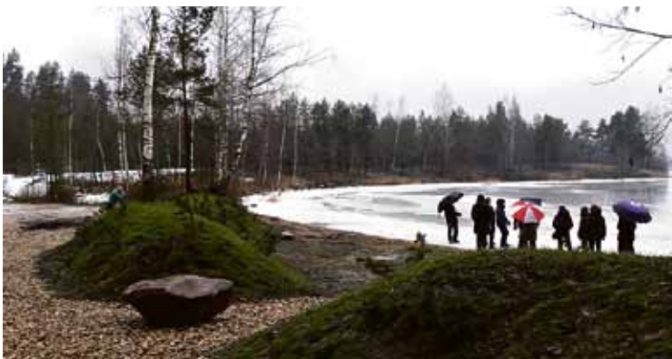
RTU studenti pie Daugavas, iepretim Nāves salai.

RTU Arhitektūras un pilsētplānošanas fakultātes studenti ainavas uzlabošanas un labiekārtošanas priekšlikumus izstrādās studiju priekšmeta „Reģionālās ainavas arhitektūra” ietvaros. Šī ir fakultātes aizsākta prakse, kad pašvaldības tiek aicinātas sadarboties ar izglītības iestādi. Šogad šajā projektā ir iesaistījušies arī Ķekavas novada pašvaldība un kā darba materiālu studentiem