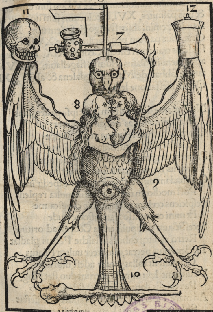
Secunda figura Ioannis

Grandis murmur erat scenophegię, bonus, est, non Doctrinans clamat, schisma fit exit ab hijs. Hic moecham saluat, lux, testis principumq; Demonio nati quem lapidare uolunt Illinit sputo Iesus tangens, maledicunt Cæco iudei, se manifestat ei Iudæis loquitur ego sum pastor bonus, unum Cum patre, blasphemū ceu lapidare uolunt Lazarus hic surgit meritisq; fideq; sororum Consilio Cayphas uaticinando preest Martha ministrat, cœnat Lazarus, & soror ungit Hinc alinus, granum, luxq; sequuntur ibi