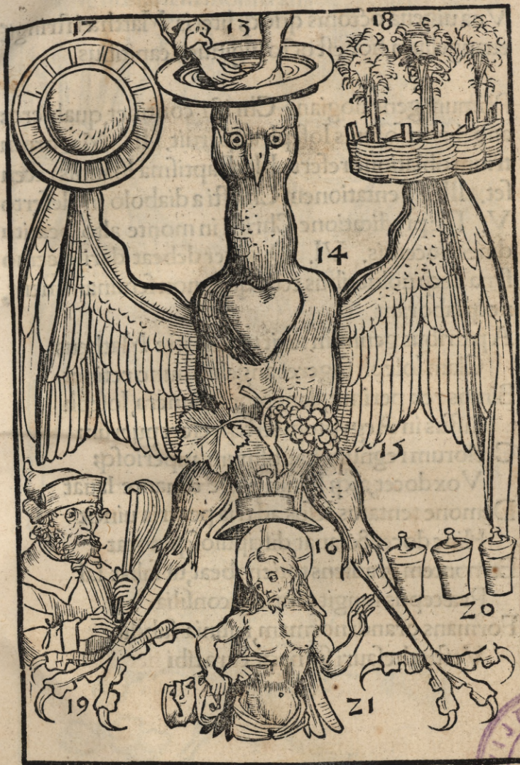
Figura Ioannis Tertia

Nudius ante diem festum lauat ipse pedes, dans Exemplum, Iudas exit, amare iubet Ostendit patrem Iesus, tua uita Philippe Credite, diligit, turbida corda fugat Palmes purgatur, p̃cepto dilige, seruos Exosus mundus cum domino retinet Quo uadam nullus querit tamen expedit ire Post modicum tristes gaudia multa replent Respiciens coelum pater inquit clarifica me Et mihi commissos sanctificare stude Secessit cum discipulis trans Cedron ad ortum Retro caditq̃ cohors, Malche Petrus gladiat Tradens plus peccat, dimittere uultq̃ Pilatus Clamant ut tollat, mater adest, moritur Ut uideant Iesu tumulū currunt duo, flet Mag. Pax clausis datur, & neuima, fides didymo Ad mare Tiberij prenduut, prandet, manifestat Se Iesus, & ter amas Petre, quid ille manet