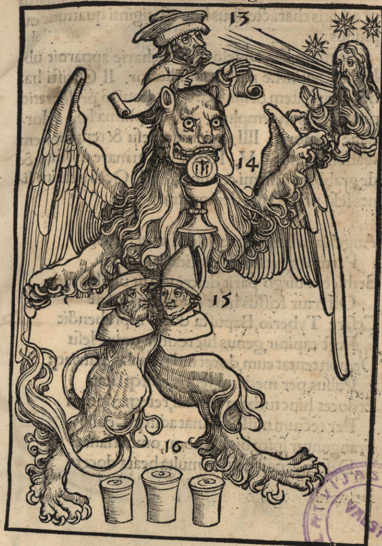
Tertia Marci imago

Non lapis ad lapidem remanebit, & hic uigila te Iudicij signa, bella famemq; notat Orat, & hic trahitur, capitur, fugiunt, sequiturq; Quem syndo uestit ducitur ad Caypham Præses mane Iesum tradit, cęsum crucifigunt Illulus moritur, uelacq; scissa cadunt Quærunt mane Iesum mulieres, Magdala primum Hunc uidet, in mundum mittit ubiq; suos