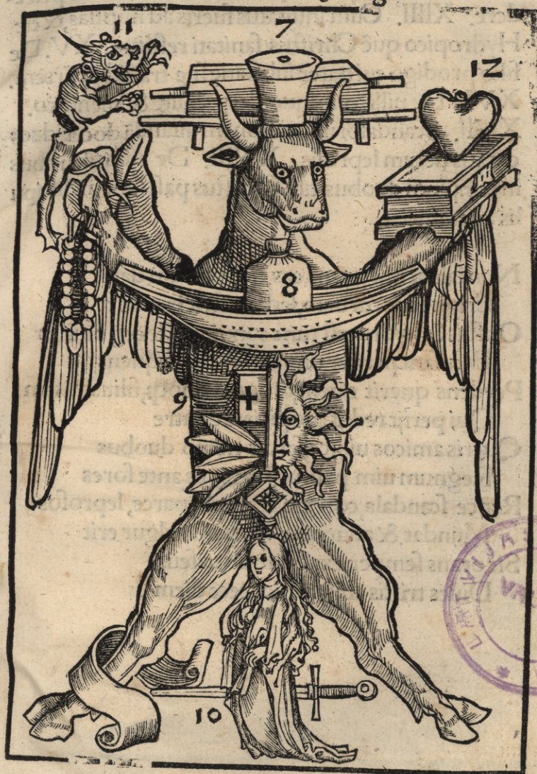
Secunda Luce imago

Grato Centurio seruum, puerum uideę dat Vox petit an ueniat, flet mulierq; rigat Hęc reliquis iuncta seruit, qui seminat exit Mater stat, cessant, turbo, cruor, legio Ite suis inquit, turbam cibam, hic aliqui stant Quos dicor, bona crux, splendet ab igne uetat Iam signans alios binos & septuaginta Et quis proximus est, est pia Martha frequens Lex datur orandi, pete, pulsa, diripit arma Ventre beat mulier, ue pharisee tibi Multa uetantur, ut est fermentum, curaq; carnis Diuicię, lumbus, querite regna prius