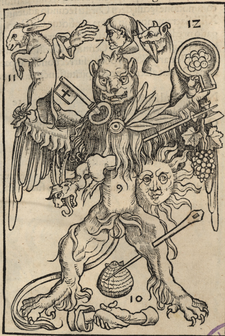
Secunda Marci imago

Gentilis natam sanat, docet inquinamenta Effata cui dicit, audit & hinc loquitur Hinc quoq; mille quater cibatur, ornat lumine cecum Petre retro uade ne neget ergo sequens Inter fratres hic transformatur se, rediensq; Curat spumantem, scandala cuncta uetat Iussit ut uxorem serues, pueros benedicit Centupla retribuet, Barthimeusq; uidet Legati soluunt asinum, fisco maledicit Cedit mons fidei, credite sic petite Mortua non surgit, mandatum scriba requirit Est dominus Dauidis, approbat gra duo