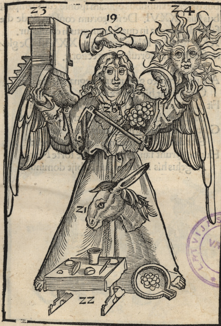
Quarta Matthei imago

Tractat coniugium, docet eunuchos pueros cit Petrus non diues linquere cuncta ualet Vno cultores gaudent titulo precij, mors Panditur, hinc natis mater ad alta petit Ascendens asinum gressu templum subit, atq̄ Subuertit mensas, natus herus moritur Bina rex uice conuiuas uocat, eijcitur qui Veste caret, cæsar que sua sunt capiat Consilium cathedre Moyfi ne facta sequamur Ve cumulat eum qui lapidantq̄ necant De mundi fine dat plurima signa Matheus Sint uigiles omnes, nam quasi fur ueniet