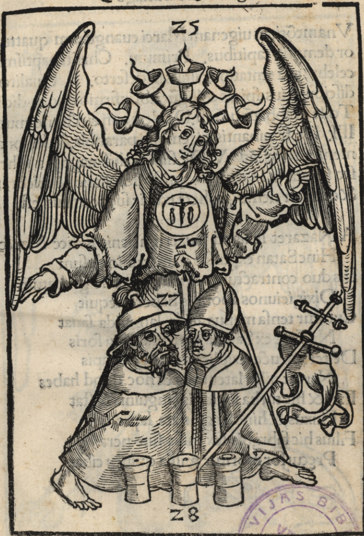
Quinta Matthæi imago

Aequat uirgineo generi tunc regna, talenta Quincem dat, hinc iudex premia digna dabit Fit conuentus, pascha suis dat, traditur unctus Captat turba Iesum, quem Petre ter renegas Guttore se Iudas stringit, Iesus ante Pilatum Stat delusus, & hunc mors rapit & sepelit Hunc querunt sancte sub uespere forte Mariae Angelus his loquitur, hinc abiit dominus