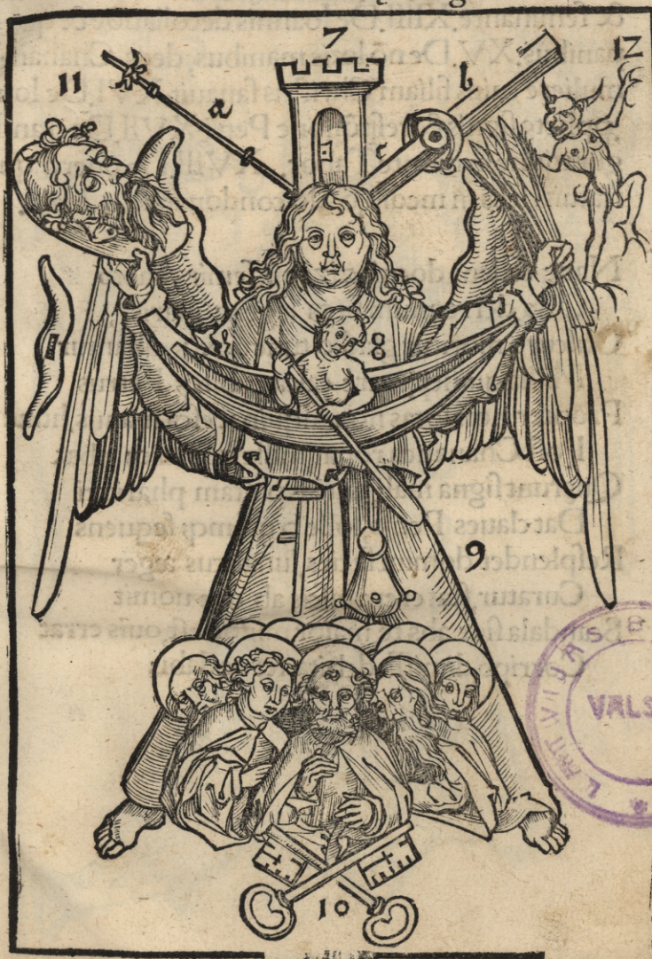
Secunda Matthei imago

Grandia do petite. iudex ne sis. uia stricta est Arbor pseudo probat. sit petra firma domus Hinc leprosum. Centurij puerum quoq; sanat Et focrum Petri. stat mare. grexq; perit Illic contractus graditur. tulit atq; Mathæum Principis & natam post fluidam reparat Iussit mira. suis dans nomina discipulis. ut Mites sint humiles & patienter agant Laudatur Baptista dei regnum patitur uim Ve tibi Corosaim confiteorq; pater Mulgentem spicas excusat demone pulso Belzebub affcribunt. signa longē dat eis