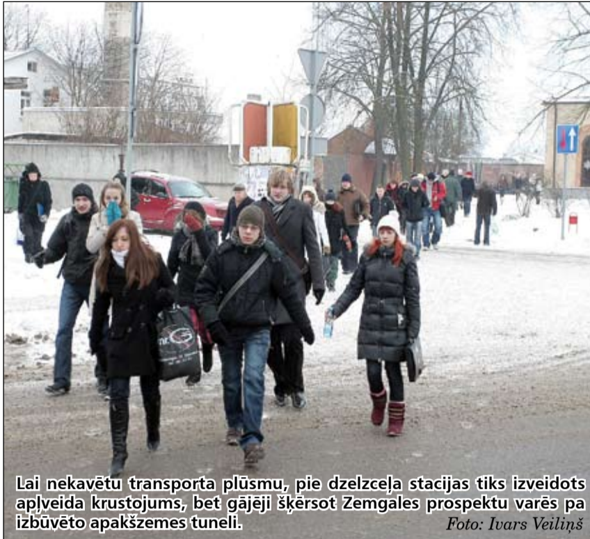
Lai nekavētu transporta plūsmu, pie dzelzceļa stacijas tiks izveidots apļveida krustojums, bet gājēji šķērsot Zemgales prospektu varēs pa izbūvēto apakšzemes tuneli.