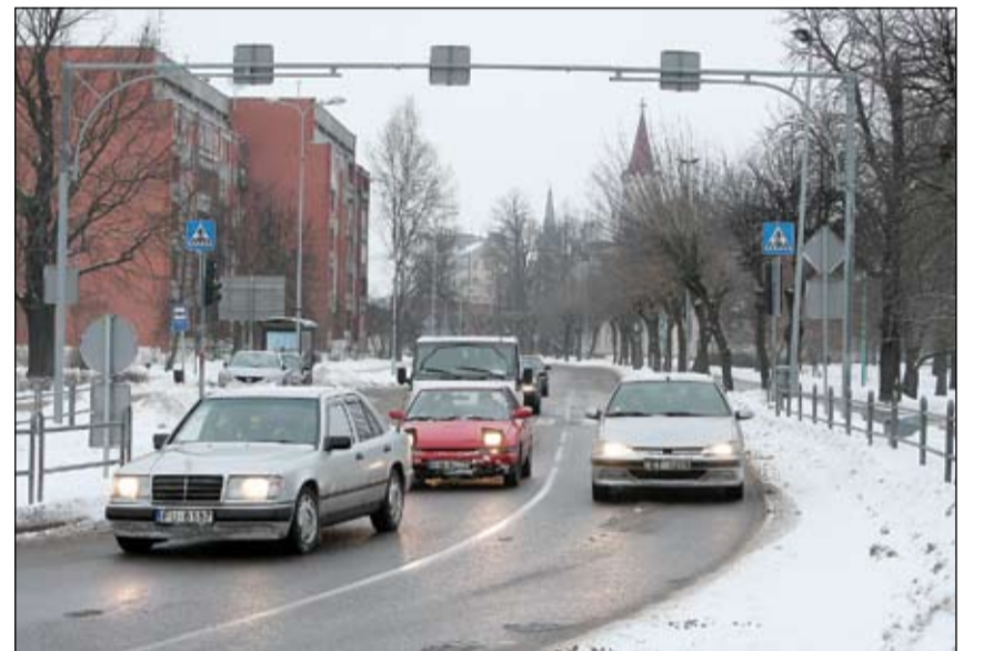
Pēc rekonstrukcijas Pasta ielas posmā no rotācijas apla līdz Jāņa ielai satiksme būs organizēta pa četrām joslām – pa divām katrā virzienā.

Ņemot vērā satiksmes dalībnieku iebildumus pret luksoforiem, kas,