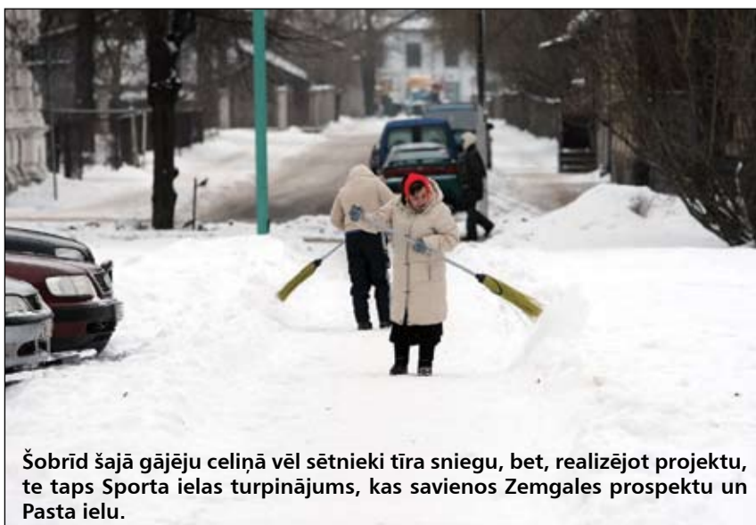
Šobrīd šajā gājēju celiņā vēl sētnieki tīra sniegu, bet, realizējot projektu, te taps Sporta ielas turpinājums, kas savienos Zemgales prospektu un Pasta ielu.