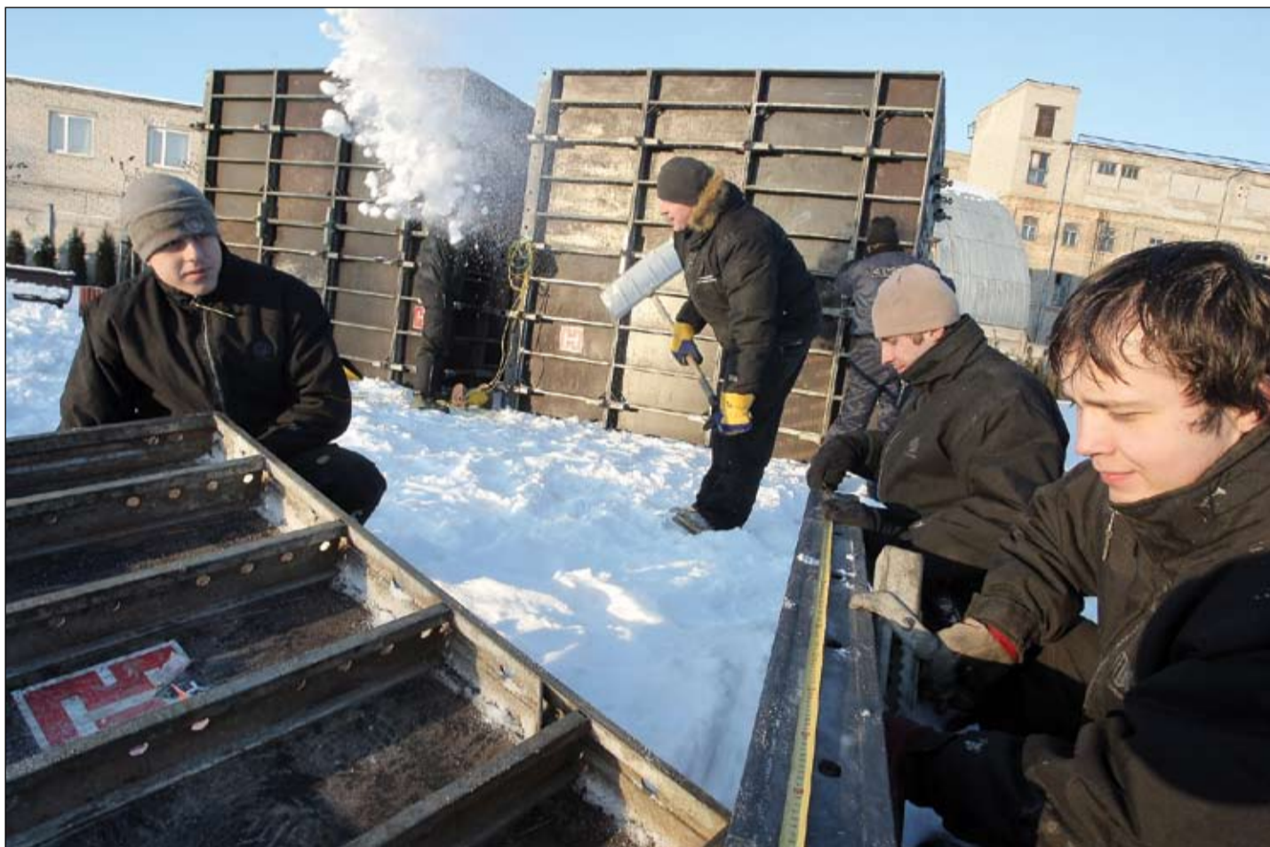
Uzvaras parkā jau sākusies gatavošanās 12. Starptautiskajam Ledus skulptūru festivālam – šajā nedēļā, izveidojot formas, likti pamati Baltijā garākajai sniega skulptūrai. Tiesa gan – pie tās veidošanas mākslinieki ķersies, sākoties festivālam.