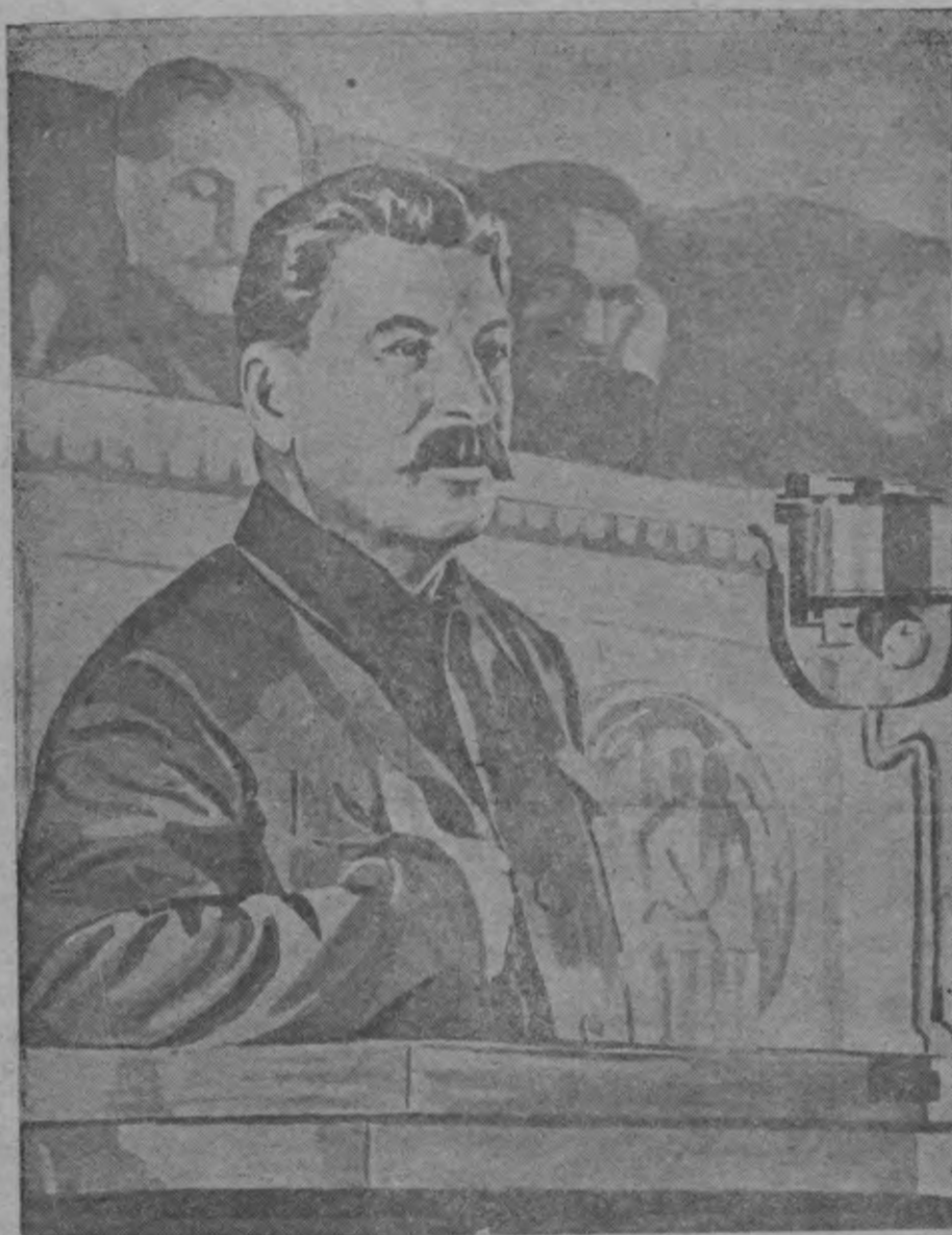
„Dzeivot palyka lobōk, bīdri, dzeivot palyka prīceigōk“. (Stalins).