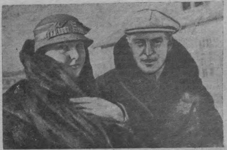
Pīdris STAHANOVŠ 1 Maja gūda gosts Moskova. BIĻDĒ: Stahanovs ar sovu sīvu.