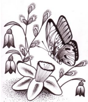
Renāte Citskovska, Pāvilstas mākslas skola