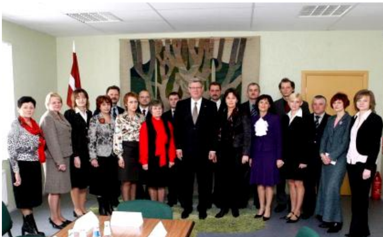
Savā darba vizītē viesojoties Pāvilostā Valsts prezidents Valdis Zatlers Pāvilostas novada domē tikās ar novada uzņēmējiem un iestāžu vadītājiem.

Ņemot vērā, ka tūrisms ir viens no Pāvilostas attīstības virzieniem, novada pārstāvji interesējās par valsts atbalstu tūrisma nozarei. Tāpat tika pārrunāta nodokļu politika valstī, īpaši uzsverot prognozējamības nepieciešamību nodokļu jomā. Noslēgumā Valsts prezidents atzinīgi novērtēja pašvaldības un uzņēmēju ciešo sadarbību Pāvilostā un uzteica vietējos pārstāvjus par konkrētu attīstības virzienu izvirzīšanu – ostas, tūrisma, zivsaimniecības un mežsaimniecības attīstība.