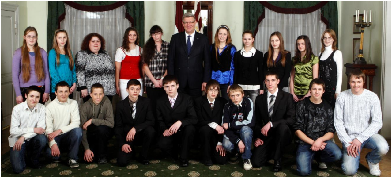
Pāvilostas vidusskolas 9.klase vizītē pie Valsts prezidenta V.Zatlera.

Kā jau iepriekšējā avīzes numurā bija vēstīts, Pāvilostas vidusskolas deviņklasnieki ikgadējā laikraksta „Diena” rīkotajā konkursā „Kas notiek?” izcīnīja 1.vietu Kurzemes reģionā.