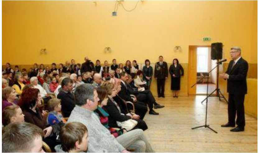
Valsts prezidents V.Zatlers uzrunā Pāvilostas novada iedzīvotājus.

„Jūs esat unikāla pilsēta”, teica Valdis Zatlers, „viena mēneša laikā pie jums viesojas divas nozīmīgas valsts amatpersonas – Valsts prezidents un Ministru prezidents! Jums nav lielu rūpnīcu, nav lidostas, bet jums ir kas ļoti vērtīgs - tīra vide, jūra, pelēkās kāpas. Tik tīras un mierīgas vides Eiropā nav daudz. Un, ja man būtu jāizvēlas, kur pavadīt laiku pie datora, tad tas noteikti