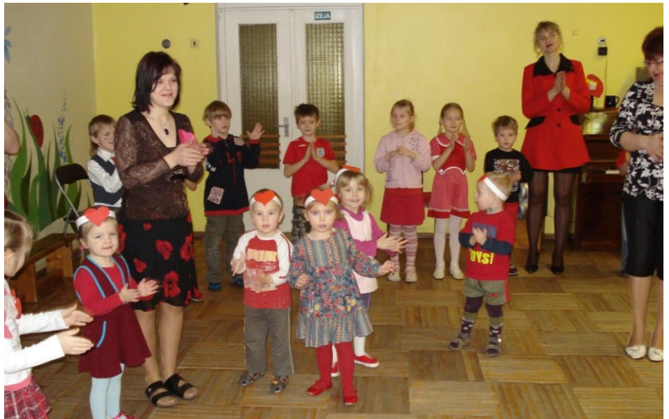
Bērni kopā ar audzinātājām jautrojās Valentīndienas disenītē.