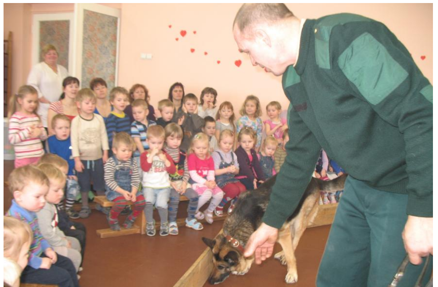
Denim tiek dota komanda meklēt narkotikas!

Atvadoties bērni varēja samīļot Deni, bet bērnudārza vadītāja G.Akerfelde, sakot paldies par apciemojumu, uzdāvināja viņam maisiņu ar gardumiem!