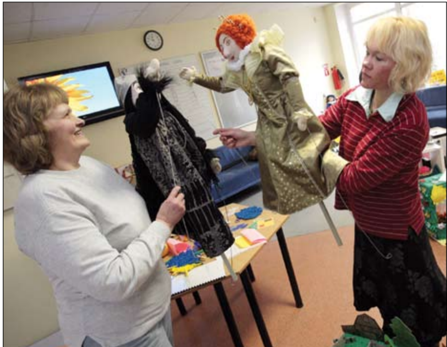
Šīs lelles veidojuši pirmsskolas izglītības iestādes «Sprīdītis» pedagogi, kuri jau pēc jaunā gada iestudēja arī leļļu izrādi «Balle pili». Tagad izstādē lelles var novērtēt ikviens.