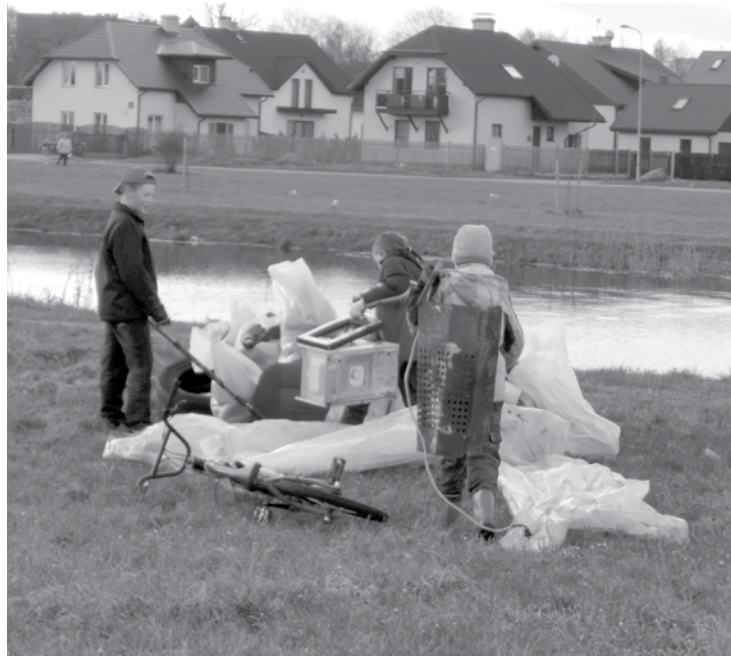
Tika iztīrītas ceļmalas, grāvji, sagrābtas lapas, apzāģēti koki un kopumā salasītas 30 tonnas atkritumu.

Ar savdabīgu moto „Šodien bez slotām – tikai ar otām!” nedaudz citāda talka norisinājās arī Iztāžu zālē, kurā ikviens interesents kora „Lōja” un Salaspils pūtēju orķestra pavadībā varēja veldzēties mākslinieciskās aktivitātēs – apskatīt rotkalšanas meistarklasē darināto rotu izstādi, piedalīties akcijā „Iztāžu zāles žoga brīnumainās pārvērtības”, kā arī apliecināt sevi dažādās citās atrakcijās. Neizpalika arī īpašās Mākslas dienu zupas baudīšana. ☺