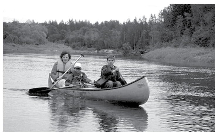
Mūsu nometnes ir teicami organizētas un bērniem drošas, un to apliecina arī atbildīgie valsts dienesti, kas veic nometņu norises uzraudzību.

Ļoti aktīvas nometņu rīkotājas ir mūsu novada sporta biedrības – šogad apstiprinātas 3 futbola un 3