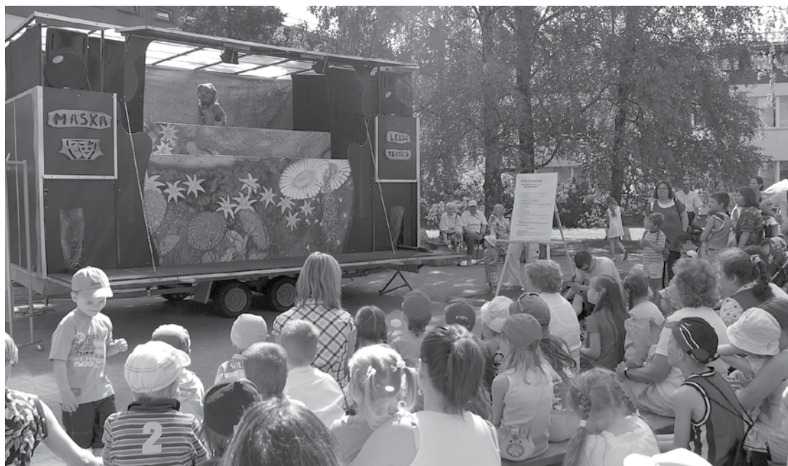
Mazākie salaspilēši lustējās Līvzemes ielas svētku „Šurumburumā” ar dziesmām, dejām, leļļu teātri un daudz dažādām interesantām atrakcijām.