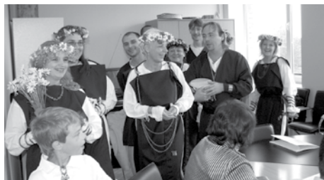
„Lōjas” līgotāji Salaspils novada domē.