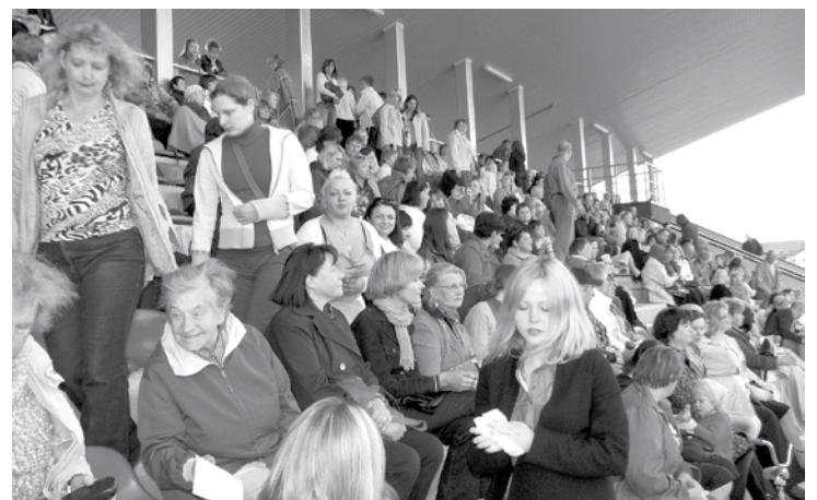
Izrādi Salaspilī noskatījās ap 800 salaspilīešu un novada viesu.

notikuma organizatoriem, uzsvērdams, ka Eiropas spēks mīt tās cilvēkos. „VIVA EUROPA 2010 sūta nepārprotamu vēstījumu, ka mēs tajā esam kopā. Tas ir mūsu pienākums – veidot godīgāku sabiedrību, kurā visi var dzīvot ar cieņu. Es patiesi ceru, ka šovakar mūs ikvienu apvienos šis vēstījums, ko sniedz kaislīgie Karmenas un Dona Hosē varoņi. Izbaudīsim neatkārtojamo Elīnas Garančas, Marčello Alvareza un pārējo dalībnieku sniegumu.”