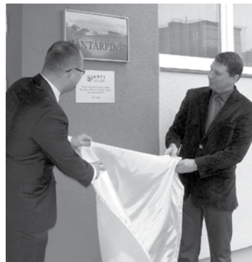
Vides ministrs Raimonds Vējonis (no labās) un Salaspils domes priekšsēdētājs Raimonds Čudars pie rekonstruētā „Jāntārpiņa” atklāj informējošo plāksni par KPFI atbalstu projektam.

To savā apsveikumā apliecināja arī izglītības un zinātnes ministre T.Koķe, minot, ka „daudz kas var pagaidīt, bet bērni – nē, viņiem nevar sacīt „rīt”, viņu vārds ir „šodien”. Rūpes par mazajiem novadniekiem ir ieguldījums