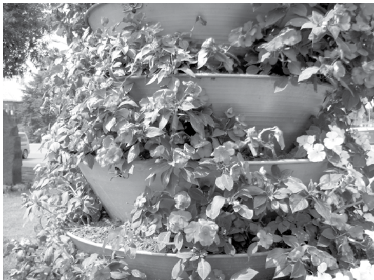
Redzot no rītiem tukšumus ziedu piramidās un puķu dobēs, stādījumu kopējas valda asaras.