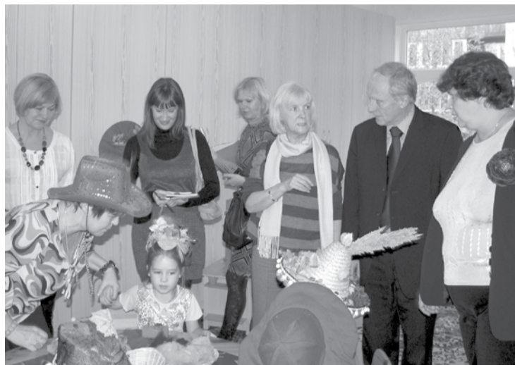
Viesi ar interesi vēroja mazākās grupas rokdarbu nodarbību.

Pieredzes apmaiņas vizītes laikā galvenokārt tika runāts par nacionāli jaukto ģimeņu izglītības valodas izvēli bērnam, kas Salaspilī ir aktuāli, jo novadā ir vidusskolas un pirmsskolas izglītības iestādes gan ar latviešu, gan krievu mācību valodu, kas dod vecākiem iespēju izvēlēties, kādā valodā bērns izglītosies. Gan