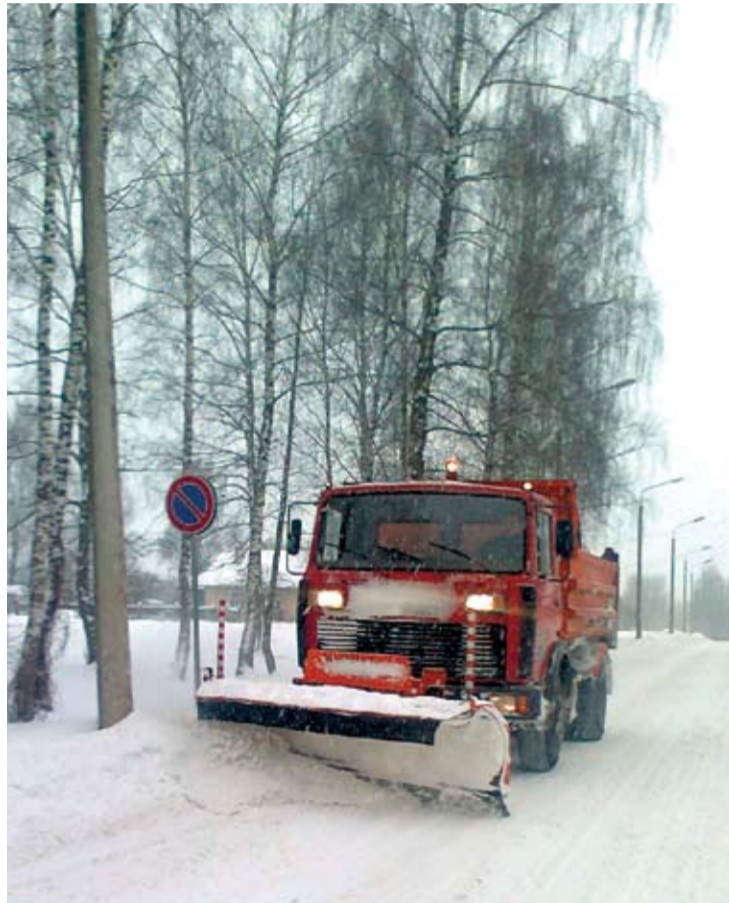
Pašvaldības pārziņā esošo ielu un ietvju tīrīšanu nodrošina Komunālais dienests.