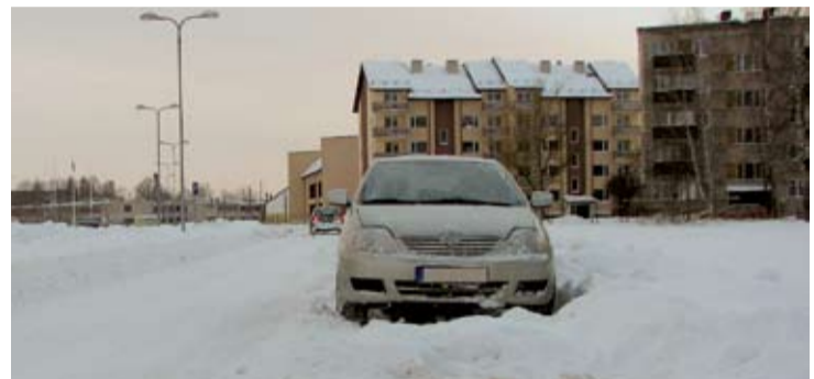
Lūdzam nenovietot savas automašīnas tīrāmajās zonās!

Salaspils novada teritorijas un tajā esošo ēku un būvju uzturēšanas noteikumi nosaka, ka namu pārvaldēm, dzīvokļu īpašnieku kooperatīvajām sabiedrībām, namīpašumu, gruntsgabalu u.c. teritoriju īpašniekiem, apsaimniekotājiem, pilnvarniekiem, lietotājiem un nomniekiem savos objektos ziemas periodā jānodrošina pieguļošo teritoriju, brauktuvi, ietvju attīrīšana no sniega un ledus un smilšu kaisīšana, kā arī pagalmu celiņu tīrīšana un kaisīšana katru dienu (arī izejamajās un svētku dienās)