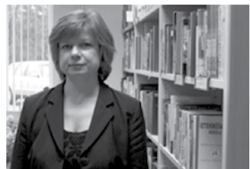
Daigai Orbidānei – skaista jubileja

Latvijas vēsturnieki Ē. Mugurēviču ievēlējuši par Latvijas ZA īsteno locekli, Latvijas vēstures zinātņu Nacionālās komitejas prezidentu un Latvijas Zinātnes padomes ekspertu. Kā nozīmīgāko prof. Ē. Mugurēviča zinātniskā darba vērtējumu varētu minēt divas LPSR Valsts prēmijas (1976, 1987), LKF Spīdolas balvu, LZA un a/s Grindeks balvu par mūža ieguldījumu Latvijas arheoloģijā un viduslaiku vēstures avotu pētniecībā, kā arī Baltijas studiju veicināšanas apvienības balvu par publikācijām Journal of the Baltic Studies. 2002. gadā Ē. Mugurēvičam piešķirta Latvijas Kultūrkapitāla fonda mūža stipendija.