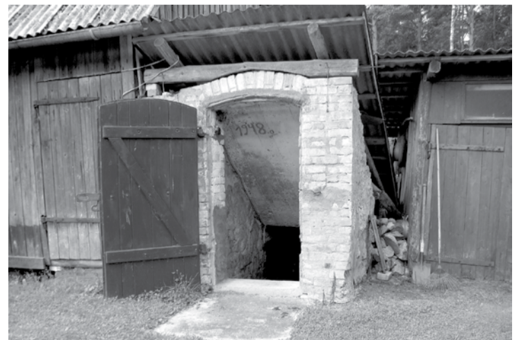
Mājas "Mailītes" īpašnieks saņēma speciālu balvu par vēsturiskās vides saglabāšanu.

Pieteikums iesniedzams 14 dienu laikā no sludinājuma publicēšanas laikrakstā „Latvijas Vēstnesis”.