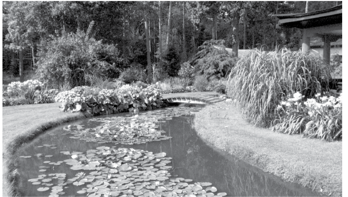
Sakoptākā viensēta – "Kārļi".

Kategorijā „Ģimenes mājas pilsētas un ciemu teritorijā” par sakoptāko tika atzīts nams Meža ielā 17, atzinīgi tika novērtētas arī mājas Saules ielā