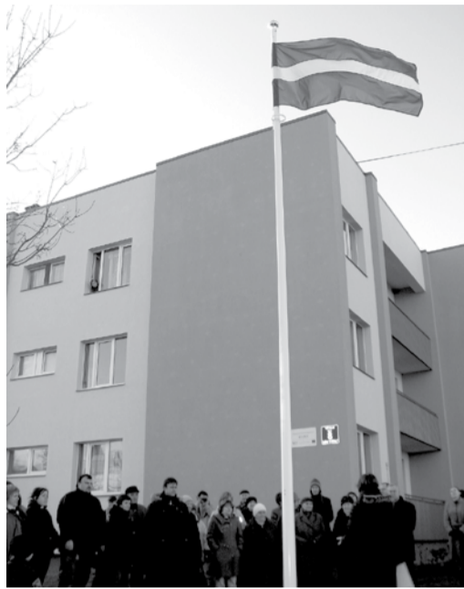
Pie ēkas Vītulu ielā 8 nu plīvo Latvijas valsts karogs.

Pašvaldība sākotnēji projekta atbalstam piešķīra divus tūkstošus latu, un šādu atbalstu arī turpmāk saņems katrā mājā, kuras iedzīvotāji spēs vienoties par renovācijas uzsākšanu. Ēku siltināšana Salaspilī vēl joprojām noris gaiši, tādēļ māja Vītulu ielā ir pozitīvs piemērs, kam varētu sekot arī citas daudzdzīvokļu dzīvojamās mājas.