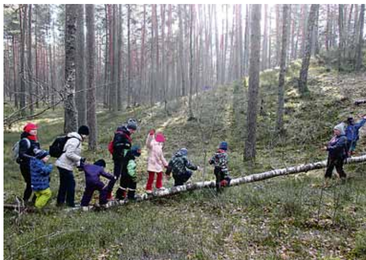
Babītes PII audzēkņi izzina mežu ekspedīcijā Beberbeķu dabas parkā.

Galvenais atzinums, ko guva mūsu bērnu vecāki un citi dalībnieki, – bērnībā pavadītais laiks dabā dod veselību un izveido ve-