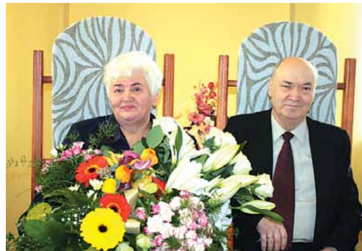
Zelta kāzas, 2017. gada 25. februāris.