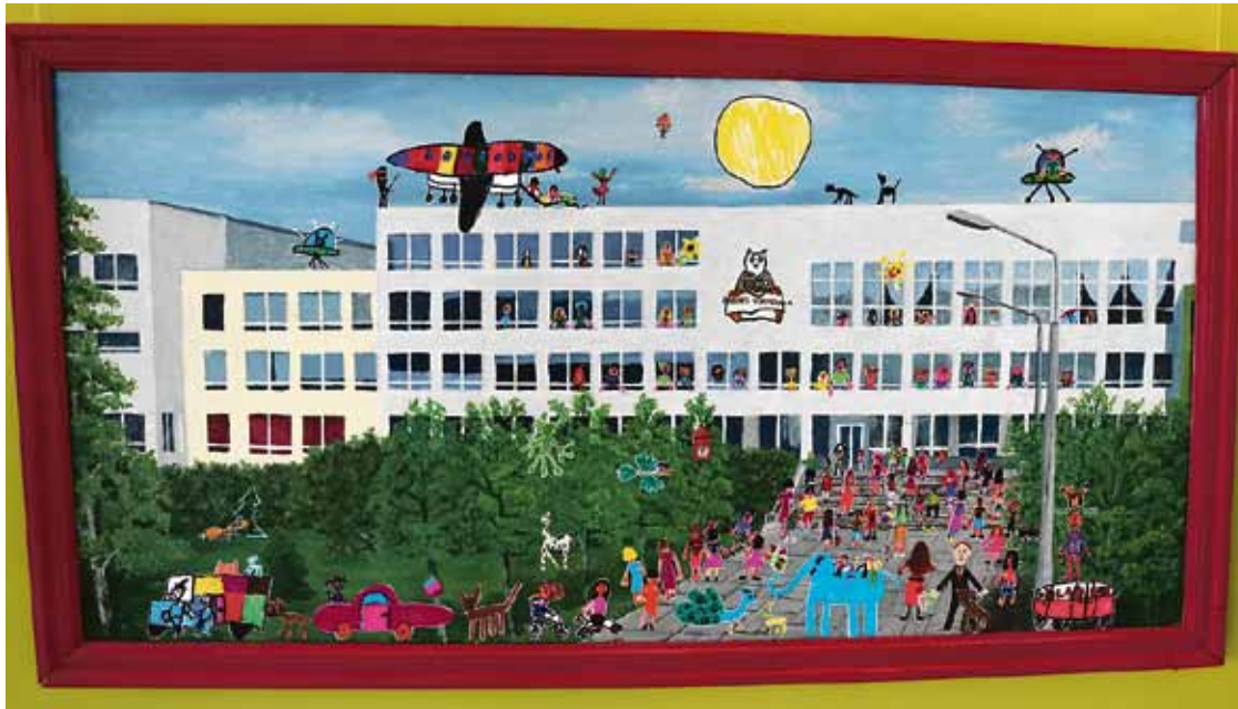
Babītes vidusskolas ēka mākslas studijas „Trīs” gleznu izstādē.

Babītes vidusskolā 7. martā ar praktisko mācībstundu programmu „Dzīvei gatavs!” viesojās AS „Swedbank” speciālisti. Programma 11. klases audzēkņiem piedāvā apgūt praktiskas zināšanas ekonomikas, matemātikas, informātikas un klases stundās,