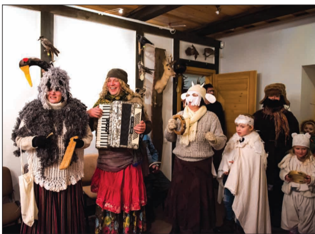
Smiltenes "čiģāni" Jērcēnmuižā