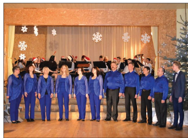
Pasākumā "Ziemassvētku serpentīns" Plāņu tautas namā