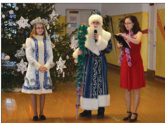
Sniegbaltīte un Salavecis Sedas skolā