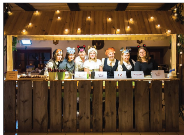
Biedrības "Esam Jērcēniem" čaklie zvēriņi