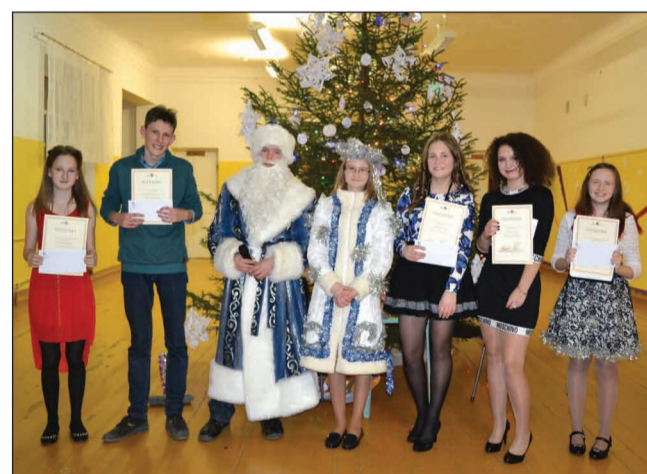
Sedas skolas čaklākie skolēni