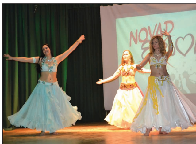
"Arābijas" dejotājas koncertā "Novadvīzija"