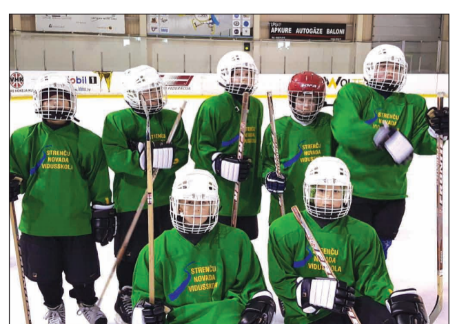
Strenču puikas hokeja turnīrā "Zelta Ripa 2017"