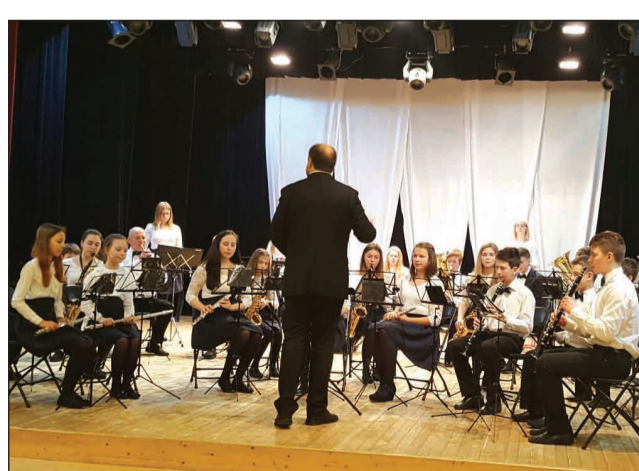
Pūtēju orķestris skatē Smiltēnē