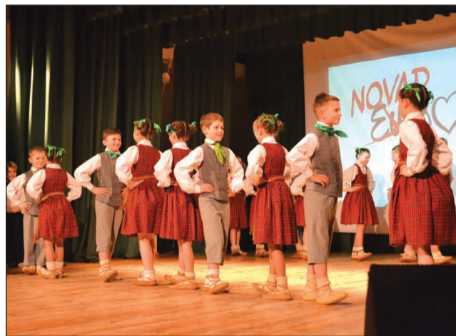
Mazie dejotāji koncertā "Novadvīzija"