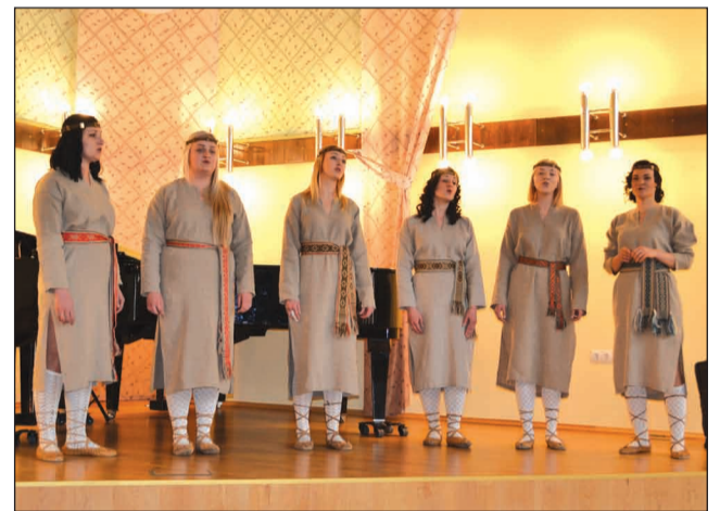
Vokālais ansamblis "Melo'dia" skatē Valkas mūzikas skolā