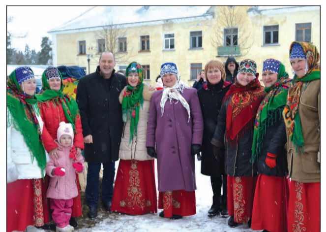
"Sudāruška" Masļenicā Sedā