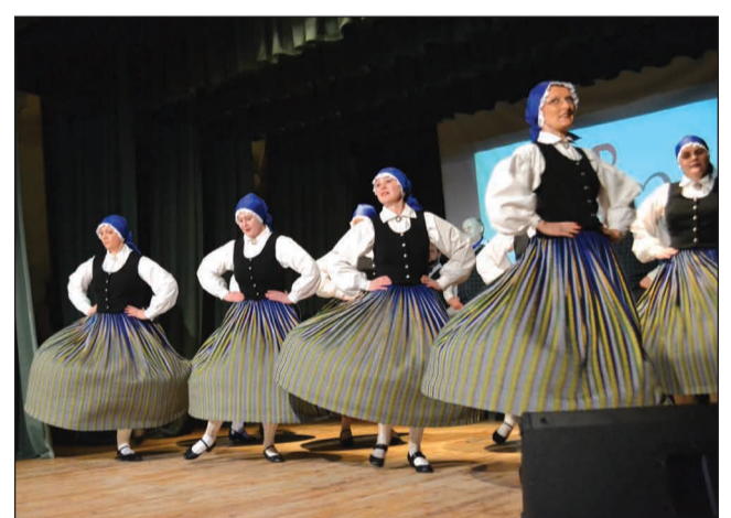
Deju kopa "Tīne" koncertā "Novadvīzija"