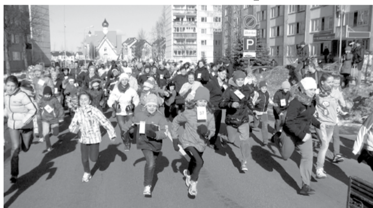
Skrējienā šogad devās 153 daiļā dzimuma pārstāves.