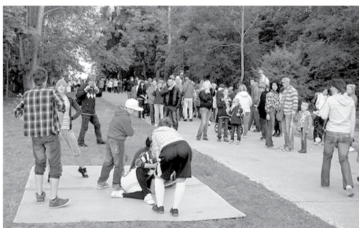
Pērn mūs novada svētki veda pie Daugavas.

Tas, kādās mājās mēs dzīvojam un kādi ir mūsu pagalmi, redzams mūsu sejās. Laiks ievēl īpašas zīmes mūsu sejās, stājā, gaitā. Tagadne savieno pagātni ar nākotni.