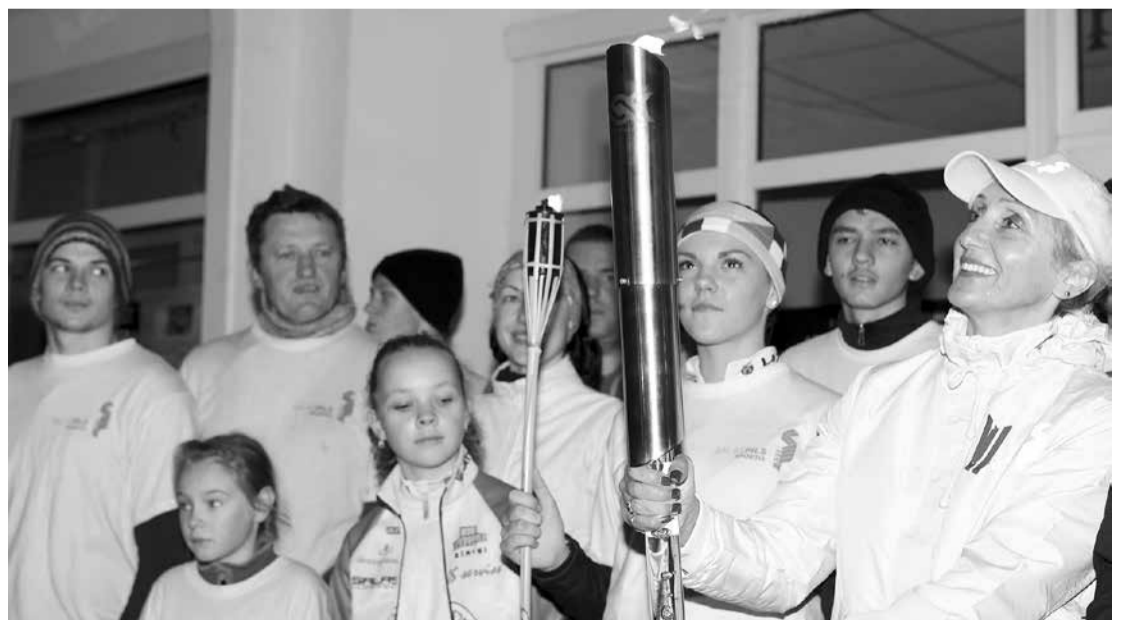
Labestības mēneša ietvaros un par godu Starptautiskajai dienai cilvēkiem ar invaliditāti jau trešo gadu pēc kārtas notika labestības un sirsnības svētki „No sirds uz sirdi”, pulcējot kopā mūsu līdzcilvēkus, kuriem nepieciešams īpašs atbalsts.