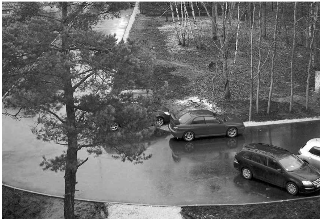
Pašvaldības līdzfinansējumu pērn saņēma Meža ielas nami, kur nu ir atjaunots ceļa segums pie daudzdzīvokļu dzīvojamajām mājām.

2013. gada 21. decembrī stājušies spēkā saistošie noteikumi Nr. 50/2013 „Par Salaspils novada pašvaldības līdzfinansējuma apjomu un tā piešķiršanas kārtību dzīvojamās mājas labiekārtošanas darbu veikšanai”, un izsludināta pieteikšanās pašvaldības līdzfinansējuma saņemšanai 2014. gada darbiem. Pieteikšanās termiņš - 15. februāris.