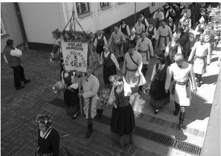
275 salaspilieši bija to 40 600 vidū, kuri ar savām skanīgajām balsīm, raito deju soli un izteiksmīgo instrumentu spēli piedalījās XV Vispārējos latviešu Dziesmu un XV Deju svētkos.