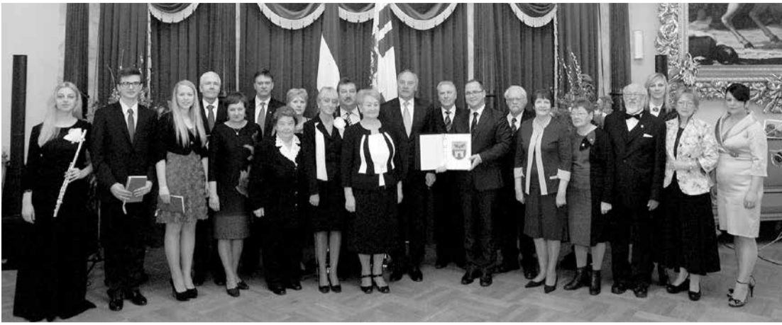
28.marta "Pašvaldību ģerboņu svētkos" Valsts prezidents Andris Bērziņš Salaspils novada pašvaldībai pasniedza jauno ģerboni.