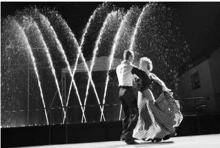
Novada svētku kulminācija pērn bija krāšņais strūklaku šovs.