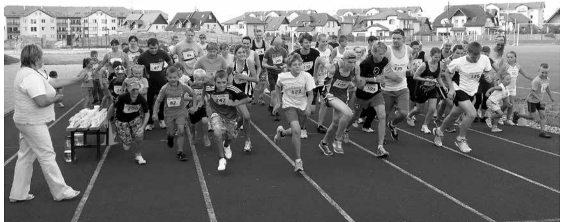
Īpaši populārs šovasar izrādījās skriešanas seriāls "Veselības trešdiena", kurā ar katru reizi piedalījās arvien vairāk skriet gribētāju.