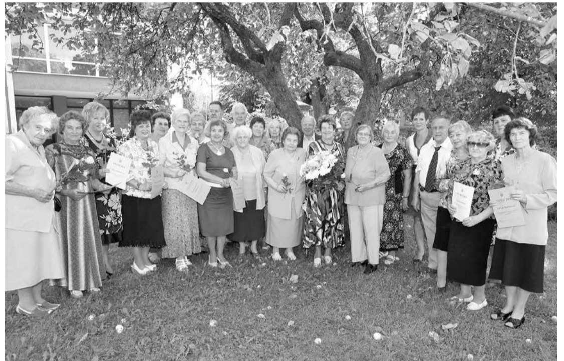
Pagājušais gads Salaspils novadā ir bijis jubilejām bagāts – 20 gadu pastāvēšanas jubileju svinēja arī Salaspils pensionāru kopa.