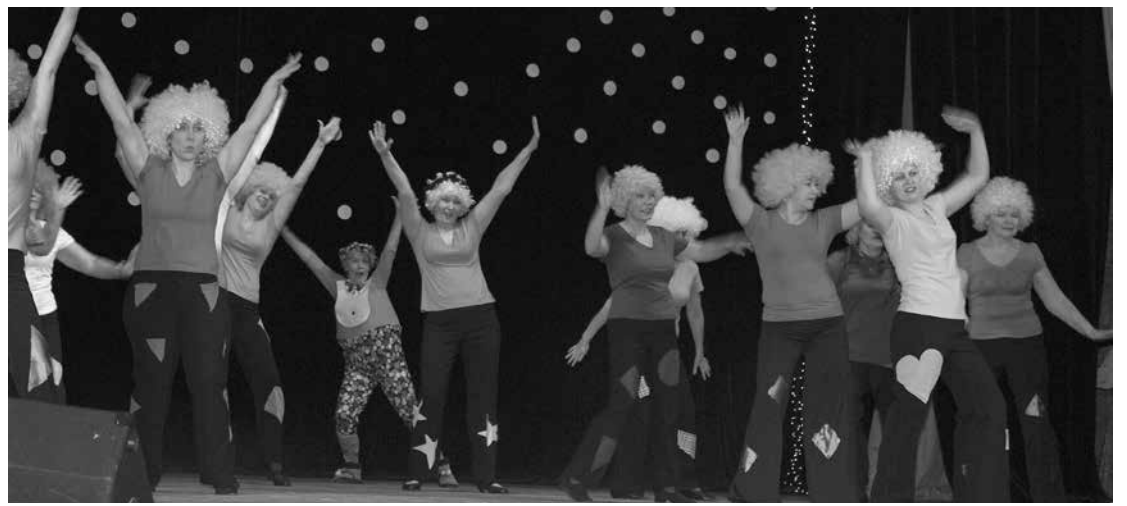
Ar atraktīviem priekšnesumiem skatītājus priecēja mūsu līnijdeju grupa „Lucia's Linedancers”.

Kolektīvi bija īpaši gatavojušies. Katra deja bija kā mazs uzvedums ar savu raksturu, noskaņu un krāsainiem tērpiem. Pie mums valdīja pavasaris, kurš turpinājās vasarā. Te bija stāsts par zivs zvejošanu, tad brīvdienā pastaiga ar sunīti, klauns ar jautrajiem palīgiem, atpūta pie jūras, zaķīšu pirtiņa. Skanēja dažādu žanru mūzika: polkas