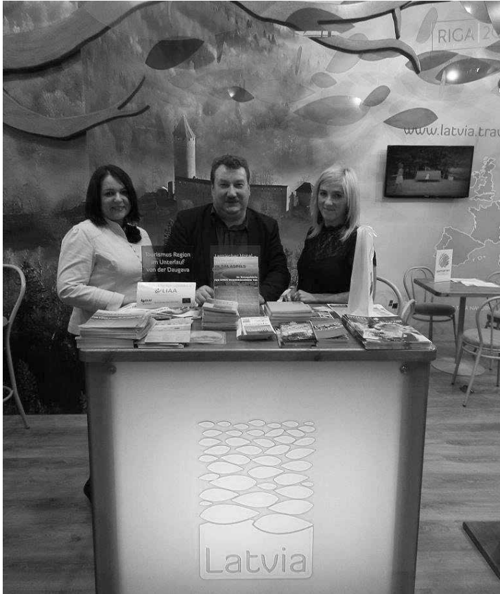
Salaspils novads veiksmīgi debitēja vienā no lielākajām tūrisma izstādēm „Reisen Hamburg”