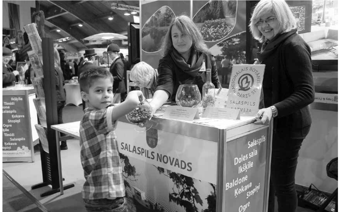
NBD pārstāves apmeklētājus cienāja ar botāniskajā dārzā audzētajām lieloģu dzērvenēm.