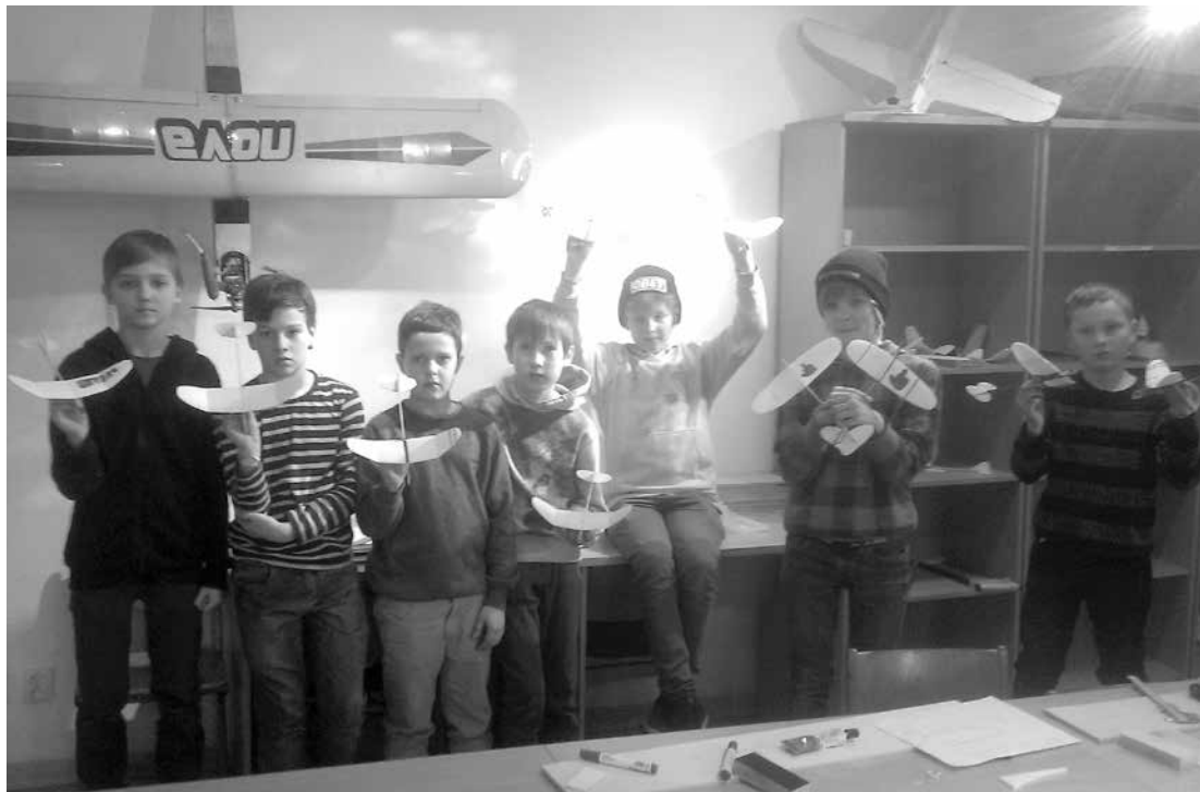
Pirmajās sacensībās iekštelpās pulciņa dalībnieki izmēģināja savu pagatavoto modeļu lidotspēju.