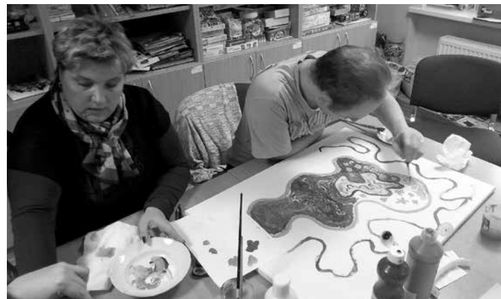
Dienas centra komanda allaž ar lielu aizrautību darbojas Radošajās darbnīcās.

Lielu pateicību izsakām ikvienam centra viesim – iestāžu un ražotņu pārstāvjiem, kuri labprāt atvēl savu darba laiku un ierodas pie mums, lai pastāstītu par savu uzņēmuma vēsturi un darbību. Ļoti jauka tikšanās nesen bija ar tējas meistaru no tējas nama „Apsara”, kurš labprāt centrā atgriezies vēl kādu reizi, lai kopā ar klientiem izbaudītu tējas dzeršanas procesu kā veselū rituālu.