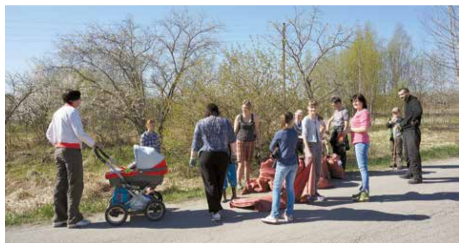
Ap divdesmit entuziastu Daces Kontrimienes vadībā talkoja Tīrumu ielā, kur „vērtīgākais” atradums izrādījās vecs televizors. Arī šeit kopā savākta milzīga atkritumu kaudze.

Vairāk fotogrāfijas no talkas Salaspilī meklējiet www.salaspils.lv !