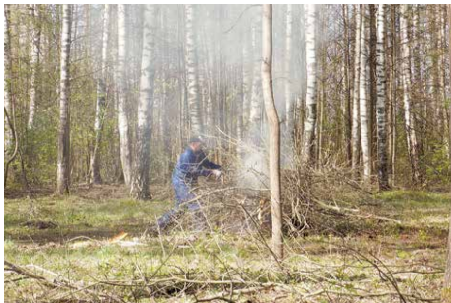
Birztaliņa HESā, kurā vēl nesen bija grūti pamanīt kādu tīru vietu, nu ir sakopta līdz nepazīšanai. Paši talcīnieki stāstīja, ka atkritumi esot bijuši daudz un dažādi- sadzīves tehnika, riepas, aptuveni 3000 PET pudeles, pat sieviešu apakšveļa, bet baisākais no tiem- vesels maiss ar šjircēm. Nav noslēpums, ka tā ir iecienīta vieta dažādiem uzdzīves meklētājiem, bet, pateicoties tam, ka talcīnieki ir izzāģējuši krūmus, birzīte ir palikusi daudz caurredzamāka, un policijai nesagādās grūtības, braucot garām, pamanīt uzdzīvotājus.