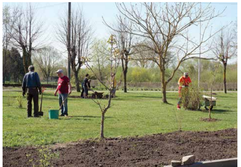
Par tradīciju kļūst arī daudzdzīvokļu dzīvojamu māju kolektīvu apvienošanās kopējām darbām. Tā, piemēram, pie Vītoli ielas 8 (attēlā) jau no paša rīta bija vērojama rosība, kur mājas iedzīvotāji veica apzaļumošanas darbus, vāca atkritumus, slaucīja pagalmu un veica citus darbus. To, ka patīkamāk ir uzturēties sakoptā pagalmā, atzīst arī silavieši. Lielu un mazu Meža ielas iedzīvotāji grāba lapas un gružus birztaliņā, kurā ik dienas rotājas apkārtnes māju bērni.