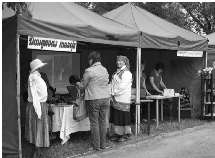
Uz pagājušā gadsimta Salaspili palīdzēja aizceļot Daugavas muzejs...