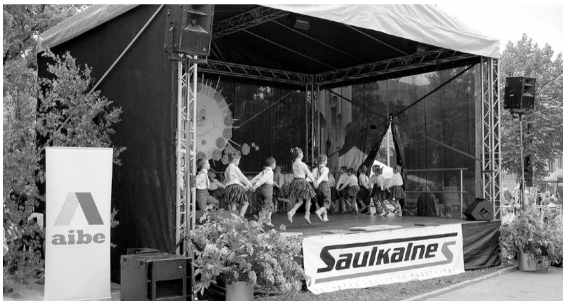
Lieli un mazi dejotāji un dziedātāji priecēja kuplo klausītāju pulku visas dienas garumā.

Pagājušajās nedēļas nogalē krāšņi nosvinējām gadskārtējos novada svētkus, kuri, kā allaž, ar dažādu pasākumu virkni vairāku dienu garumā vienoja mūsu iedzīvotājus. Tradicionāli svētki noris maija pēdējā nedēļā – laikā, kad skolās mācību gads ir tik tikko kā noslēdzies, bet kultūras nami pirms došanās atvaļinājumā atskatās uz sezonā paveikto, lai to svētkos varētu parādīt saviem novadniekiem.