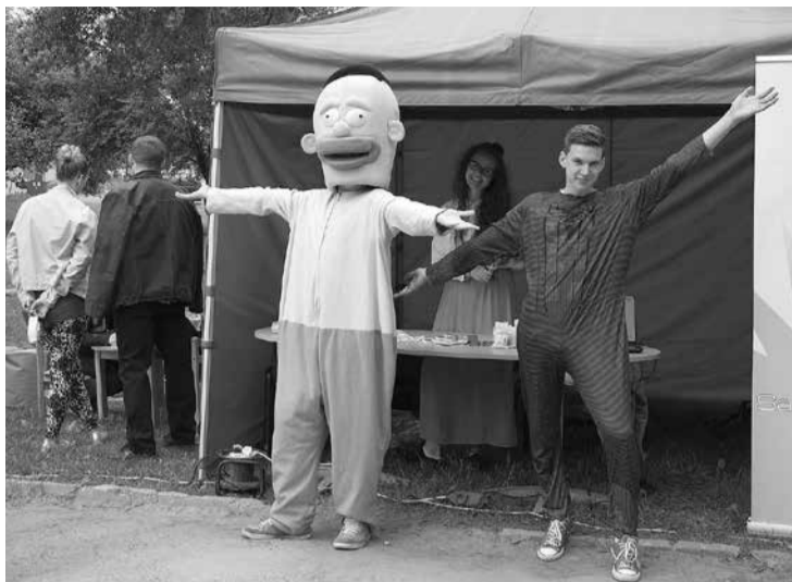
Kā allaž, aktīvi svētku palīgi ir jauniešu organizācija „Zibsnis”, kuri bija sarūpējuši šķēršļu trasī mazākajiem salaspiliešiem.

Visas dienas garumā šeit norisinājās arī svētku tirdziņš, kurā varēja iegādāties dažādu amatnieku izstrādājumus, kā arī nobaudīt gardu maltīti. Bet starp tirgotā-