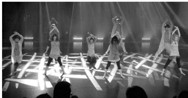
Piektdienas un sestdienas vakarā ar emocijām bagātu koncertu svētkos salaspiliešus sveica „Buras”.