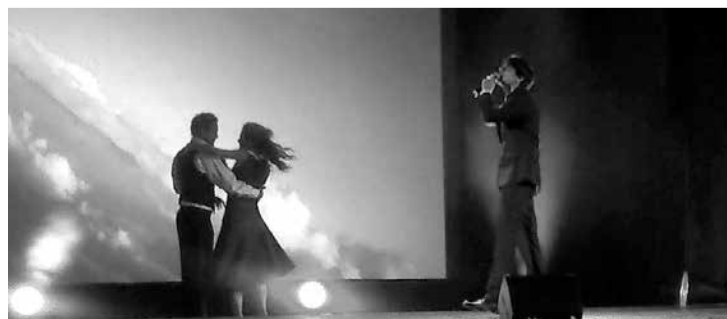
Bet vakara noslēgumā pie sporta halles visi svinētāji sapulcējās, lai izdzīvotu četrus mīlestības gadalaikus. Uz tikšanos nākamgad!