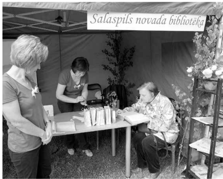
Pērnā gadsimta 20. un 30. gadu grāmatas un avīzes ieinteresēja ne vienu vien garāmģājēju, kuri šeit uzkavējās, lai palasītu vērtīgo literatūru.