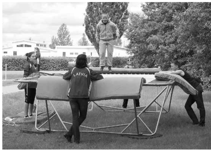
Svētku „burziņā” varēja vērot arī paraugdemonstrējumus uz īsta batuta, bet mazākie svinētāji to varēja izmēģināt arī paši.

Paldies visiem dalībniekiem un apmeklētājiem par skaistajiem svētkiem, par kopā būšanas mirkli! Un organizatori atvainojas halles apkārtnējo māju iedzīvotājiem, kuriem bija traucēts naktsmiers. Svētkus radām, lai salaspilieši varētu kopā liksmot un priecāties, nevis, lai radītu jums neērtības. Tomēr atcerēsīties, ka svētki ir tikai vienu reizi gadā, kad svinēt un priecāties ir aicināti visi novadnieki! Uz tikšanos nākamgad!