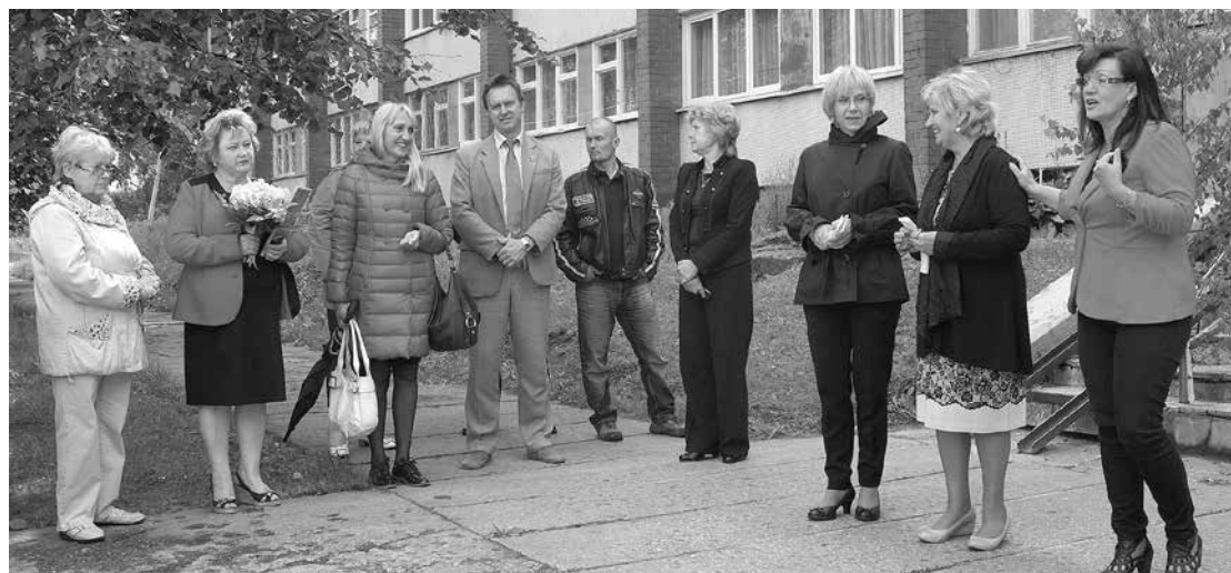
Aconiešus ar jaunā Sociālā centra izveidi sveica Salaspils novada pašvaldības vadība un Sociālā dienesta pārstāvji.