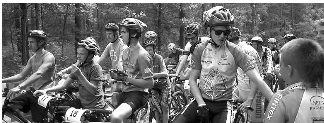
Velokrosā uz starta stājās 150 dažāda vecuma riteņbraukšanas entuziasti.

namam, SIA “Lattims”, “Ezerkauliņi” un sporta preču veikalam www.velostore.lv - par atbalstu pasākuma