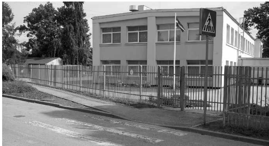
Šo gājēju pāreju pie PII „Ritenītis” likvidēs, bet uzstādīs zīmi „Dzīvojamā zona”, kas autovadītājiem ļaus pārvietoties ar ātrumu 20 km/h.

Komunālā dienesta darbinieki drīzumā zīmes uzstādīs.