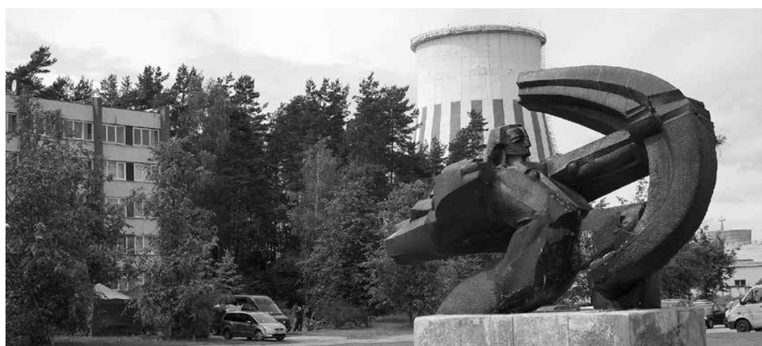
Pašreizējais Acones ciems izveidots, domājot par Rīgas TEC-2 strādnieku izmitināšanu, tamdēļ tas atrodas tiešā termoelektrocitrāles tuvumā.

Viena no novada izvirzītajām attīstības prioritātēm – kvalitatīva un pievilcīga dzīves vide, nodrošinot iedzīvotājiem pievilcīgu dzīves telpu un nepieciešamos publiskos pakalpojumus iespējami tuvu dzīvesvietai. Izvērtējot vēsturiski izveidojušos apdzīvotuma struktūru, iedzīvotāju skaitu, apbūvi, sociālās infrastruktūras un pakalpojumu nodrošinājumu, tiek izdalīts novada nozīmes centrs – Salaspils, lauku apdzīvotuma centri un vietējas nozīmes attīstības centri. Viens no tiem – Acone.