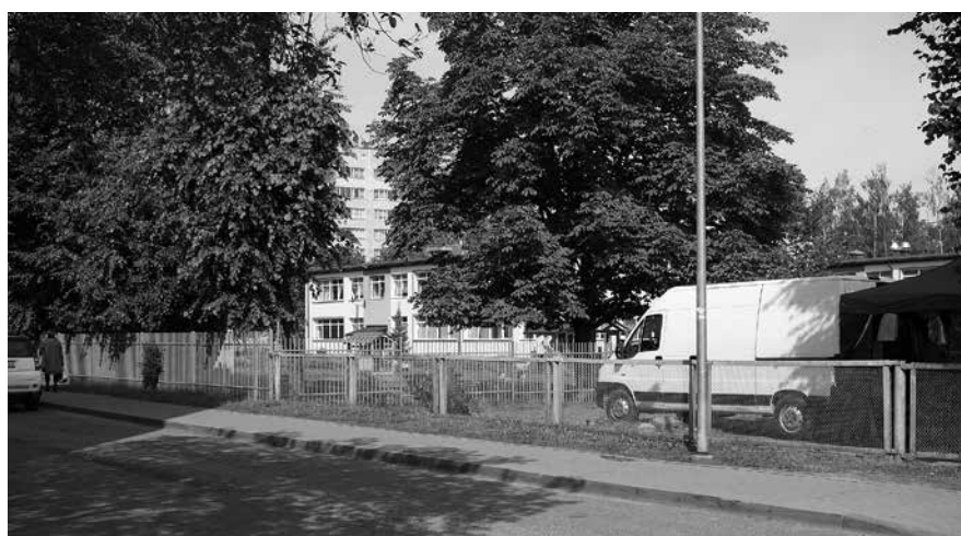
Pie „Jāņtārpiņa” un tirdziņa uzstādīs zīmi „Stāvvietā” ar papildzīmi „Stāvēšanas ilgums 30 min”.

Apstiprināts Salaspils novada domes sēdē 2014.gada 13.maijā (prot.Nr.10, 2.§) Precizēti: 11.06.2014., prot.Nr.12, 3.§