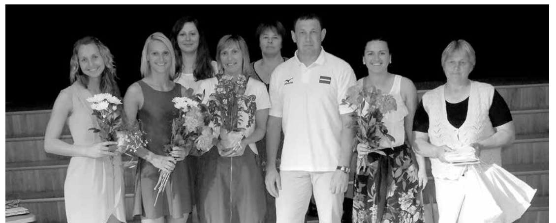
Paldies sporta skolas treneriem un administrācijai par ieguldīto darbu audzēkņu labā!

3. jūnijā k/n „Rīgava” tika aizvadīts sporta skolas 2013./2014. mācību gada noslēguma pasākums.