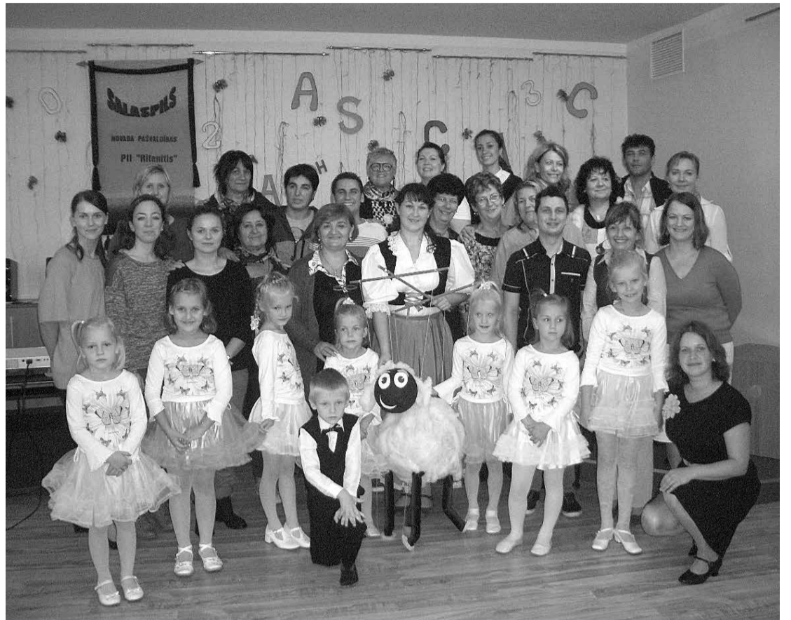
Projekta ietvaros „Ritenītī” ir norisinājušās dažādas aktivitātes, kas ir palīdzējušas labāk apgūt angļu valodu kā bērniem, tā arī audzinātājiem.

Interesanta sadarbība mums izveidojās ar Salaspils 1. vidusskolas 6. klases skolēniem un skolotāju. Skolnieki vairākkārtīgi viesojās mūsu bērnudārzā, un bērni no 3.grupas devās ciemos uz skolu, lai, kopīgi rotaļājoties un spēlējoties, viens otram iemācītu ko jaunu un demonstrētu jau apgūtās dziesmas un pat iestudētās teātra izrādes. Daudz jauku un pozitīvu emociju guva mūsu bērni. Paldies par līdzšinējo