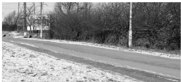
Vēl šoziem ceļš uz Doles staciju izskatījās šādi.