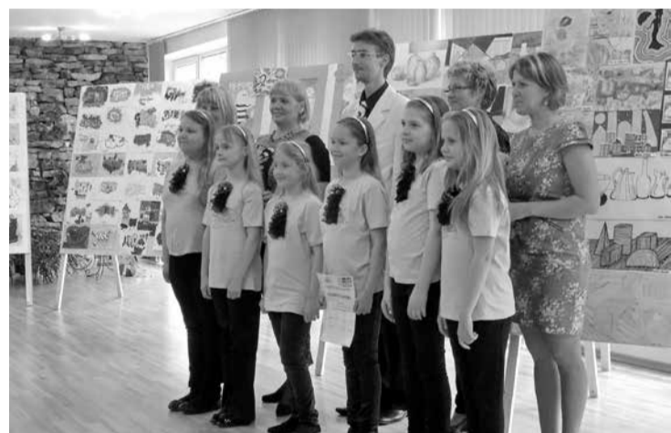
Labāko skolēnu zīmējumu izstāde nu ir atceļojusi no „Rīgas” uz Acones sociālo centru. Foto no izstādes atklāšanas „Rīgavā”.

Tā nu ir sanācis, ka visapmeklētākais centrs ir otrdienās un ceturtdienās, kad te viesojas vairāk kā desmit bērni vecumā no 8 līdz 13 gadiem. Viņiem šeit ir iespēja radoši darboties. Bērni ir ļoti apmierināti, ka nu viņiem ir tāda