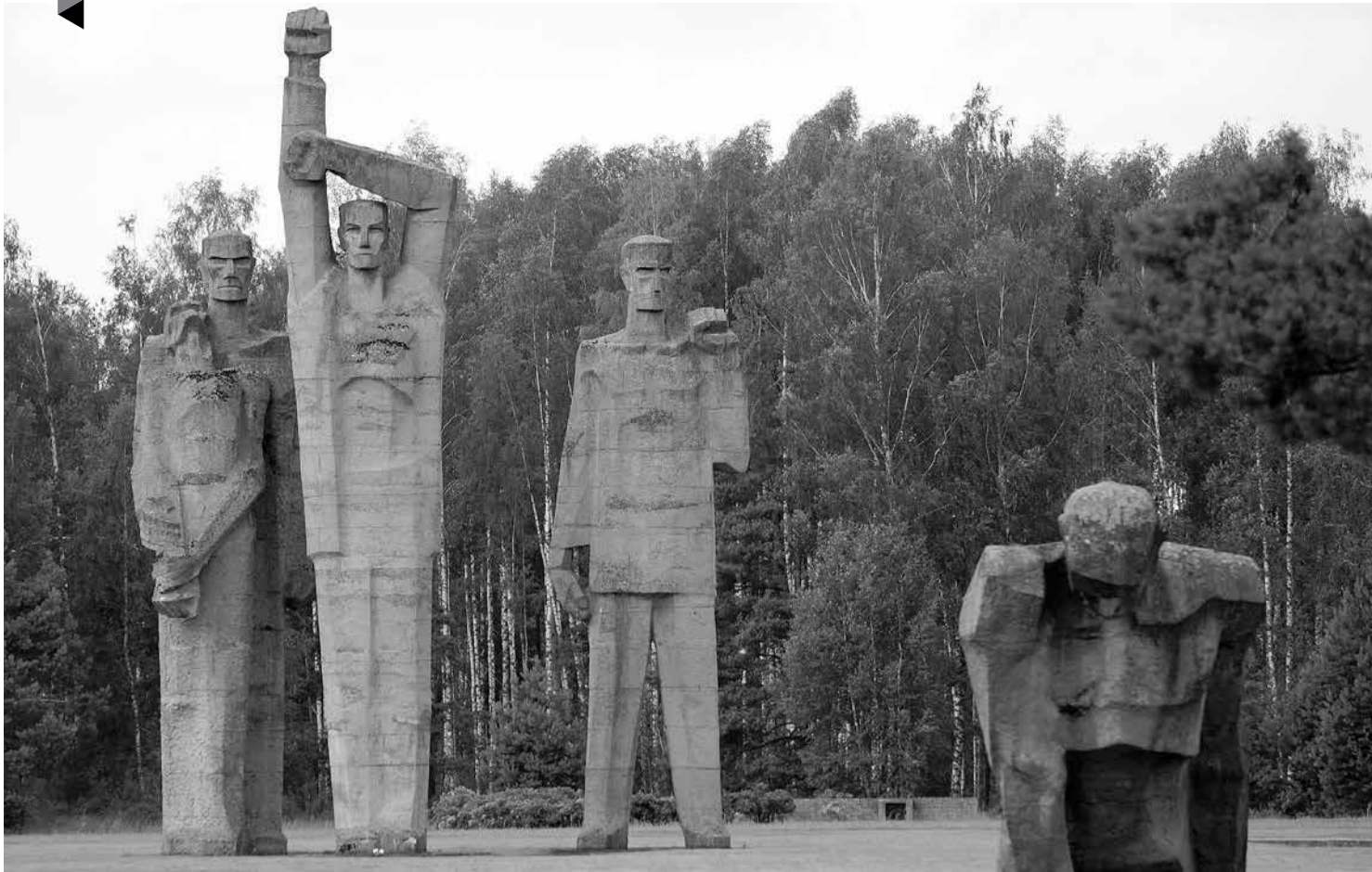
Salaspils memoriālais ansamblis ir laikmetīgs mākslas darbs, kas guvis pelnītu ievēribu arī ārzemēs un iekļauts Latvijas kultūras kanonā.

dēmijas. Ja ieslodzītajam nav iespējams saņemt pārtikas sūtījumus no piederīgajiem, pastāvīgi jācieš no bada.