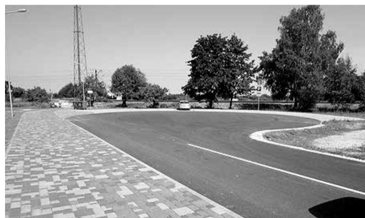
Kalnrozes ielā ir izbūvēta brauktuve, gājēju un velosipēdistu ceļiņš, izveidots stāvlaukums un uzstādīts apgaismojums.