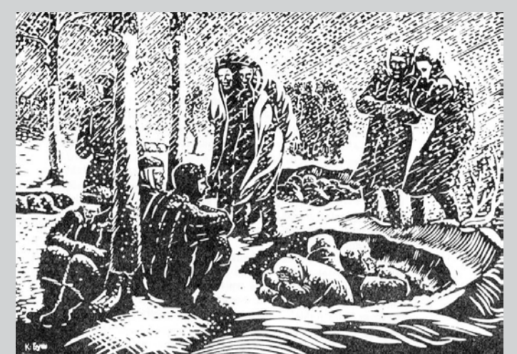
„Karagūstekņu nometnē”, K. Buša linogriezums, reprodukcija no grāmatas „Salaspils nāves nometnē”.

Nometnes teritorijā atrodas arī komandantūra, sardzes tel-