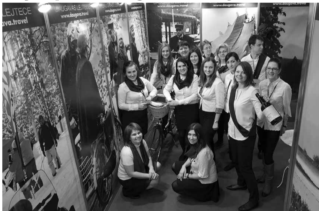
Daugavas lejtes tūrisma reģiona stenda gidi ikvienam apmeklētājam piedāvāja iepazīties ar sešu novadu skaistākajām vietām.

Daugavas lejtes stendā darbojās 20 zinoši tūrisma speciālisti, kuri apmeklētājus aicināja doties ekskursijā pa Daugavas lejtes novadiem, noskaidrojot savu tūrista gēnu. Lai to noskaidrotu, gidi uzdeva jautājumu- cik daudz riteņu būs jūsu transporta līdzlim? Ja neviens, tad tavš gēns ir „elpo ar pilnu krūti”, ja divi, tad- „vējš matos”, bet, ja ceļo