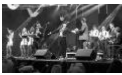
Ar elektrosvingu, balkānu motīviem un latgaliešu dziesmiņu skatītājus priecē brāļi Auzāni un „Slavenais Jersikas orķestris”.