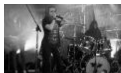
“Dead Rats” - Salaspils grupa, kurā domine meitenes.