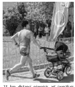
21 km distanci pieveicis arī jaunākais Salaspils pusmaratona dalībnieks. Prieks, ka jau no tāda vecuma bērni tiek radināti pie sportiskām aktivitātēm.