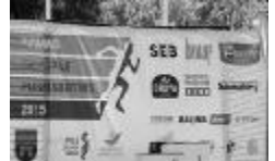
Paldies visiem svētku atbalstītājiem un sponsoriem!