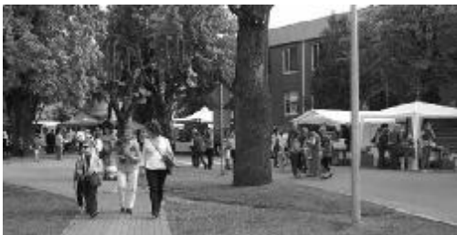
Svētku epicentrā varēja ne vien baudīt lieliskus priekšnesumus, bet arī iegādāties kādu našķi, mākslinieku darījumus un daudz ko citu.