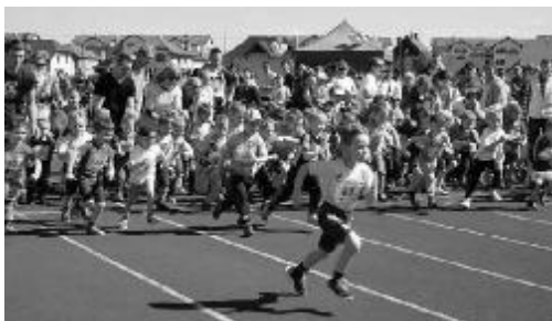
Par uzvarētāja titulu cīnās mazākie sportisti, kuriem trasē līdzī devās arī vecāki. Neskatoties uz to, ka uz goda piedestāla ir vien trīs pakāpieni, balvas saņēma visi dalībnieki.