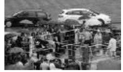
Lietus nebija šķērslis dramatiskām un aizraujošām cīņām par Salaspils kausu.