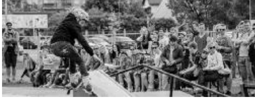
Ekstrēmo sporta veidu cienītāji tikās skeitparkā, kur notika sacensības trijās disciplīnās - SKATE, BMX un INLINE.