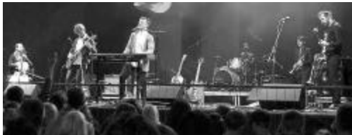
Svētku kulminācija - grupa „The Sound Poets”. Lai dzīvo svētki!