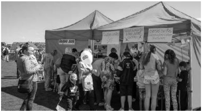
Stadionā varēja ne tikai skriet un nodarboties ar citām fiziskajām aktivitātēm, bet varēja izveidot pusmaratona laimes putnu radošajās darbnīcās. To piedāvāja Daugavas muzejs, Sociālais centrs un Dienas centrs.