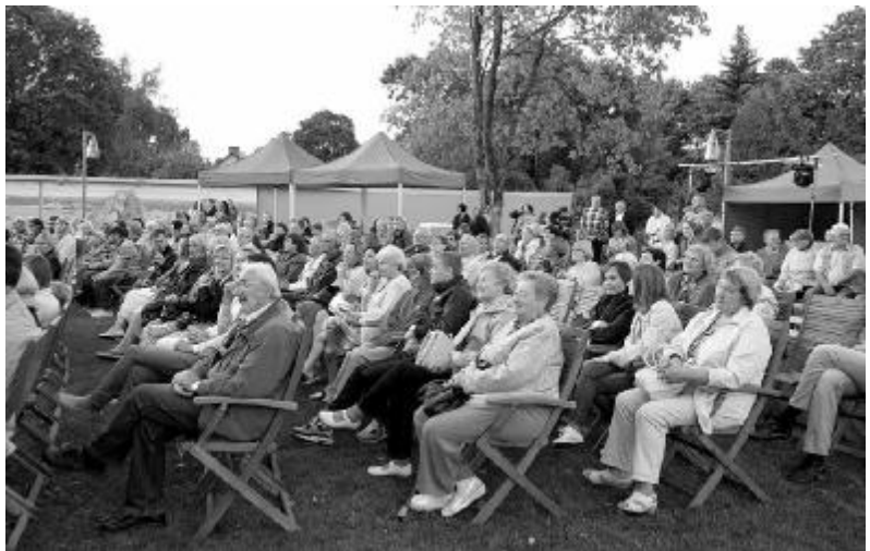
Ar oficiālajām uzrunām, lielisku mūziku un atmosfēru 28. augustā tika atklāts Rīgavas mākslas dārzs. Lai arī lūgti!