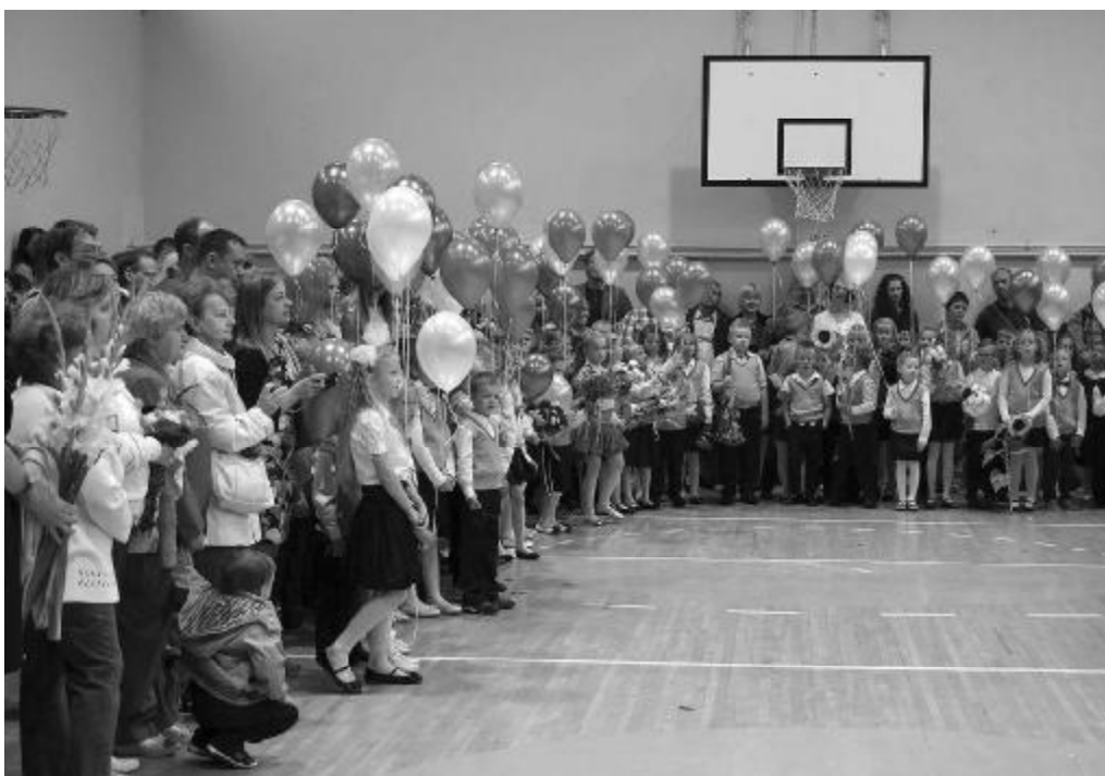
Savas mācību gaitas 1. vidusskolā šogad uzsāk 118 pirmklasnieki.

Ceru, ka nepieciešamība mainīt mācīšanas un mācīšanās para-