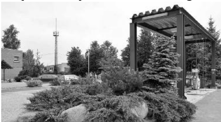
Padomjulaiku silkkātkieģeļu un betona ieskāvējumā SIA «SIMP» īpašnieks pratis veiksmīgi iekombinēt akmeņu grupas un skujkoku stādījumus.

Sakoptāko īpašumu meklējumi konkursa komisijai ik gadus ir gana smags pārbaudījums. Stūru stūriem tā Tēvu zeme padevusies, ej nu saproti, kurā stūrī tas skaistums un tā sakoptība nolēmusi šoreiz paslēpties. Uz pieteikšanos un kaimiņu pieteikšanu konkursam bijām kā allaž gana kūtri, ja godīgi, īpaši naski nekad neesam bijuši. Var tikai minēt, kā būs nākotnē, bet arī šī gada konkurss ir galā, un zināmi arī tā uzvarētāji. Priekšā palikusi vēl tikai lielā godināšana.