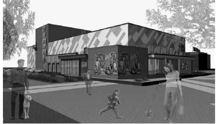
"Enerģētiķis" pēc rekonstrukcijas.

Būsim aktīvi un piedalīsimies sabiedriskajā apspriešanā, lai vēl viena ēka novadā kļūtu modernāka.