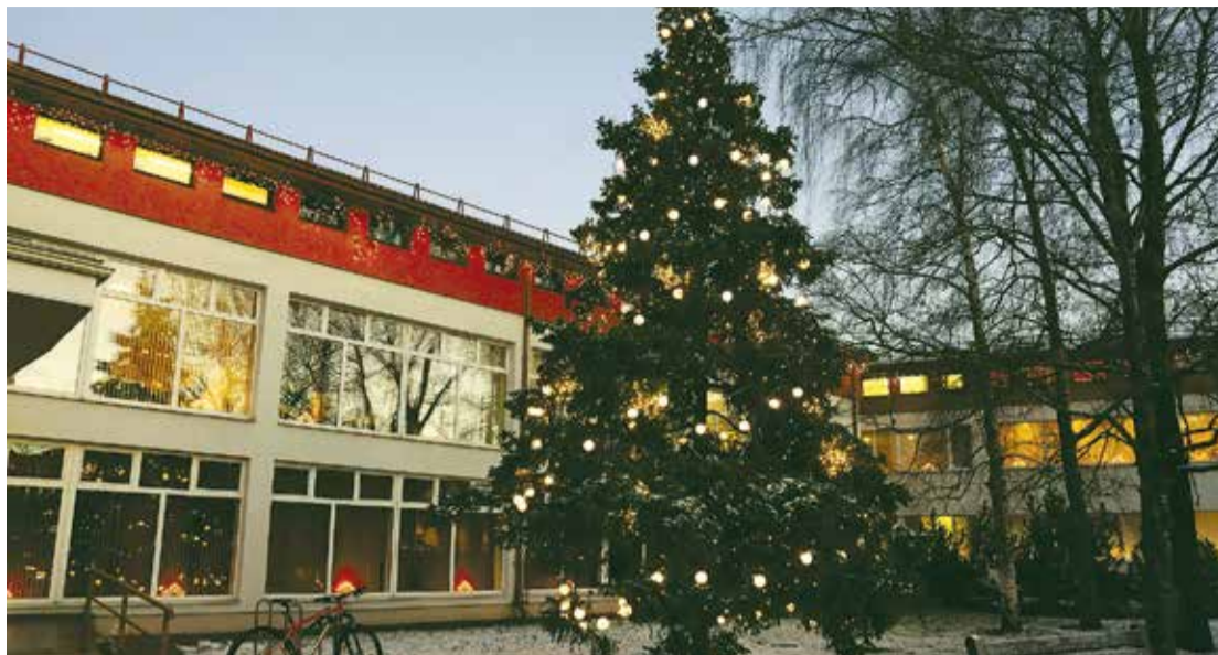
Ar "Komunālā dienesta" darbinieku čaklajām rokām skolēniem, pulciņu dalībniekiem un visiem garāmgājējiem svētku noskaņu rada krāšņā egle pie "Rīgavas".

Žēl, ka tas, kas daudziem sagādā prieku, kādam acimredzot traucē, jo pagājušajā nedēļas nogalē bez lampiņu virtenes palikusi egle Dienvidu ielā. Varam meklēt līdzību ar populārās amerikāņu filmas varoni Grinču, kurš salaspilīšiem grib nozagt Ziemassvētkus. Tāpēc lūdzam iedzīvotājus būt modriem un, ja pamanāt kādu, kas bojā svētku egles, nekavējoties vērsieties pašvaldības policijā. Sargāsim gada skaistāko svētku simbolus!