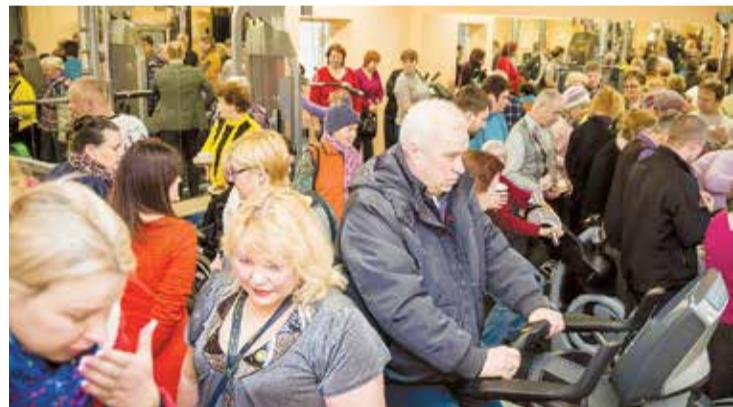
Trenāžieru zāles atklāšanas pasākums 3. decembrī.