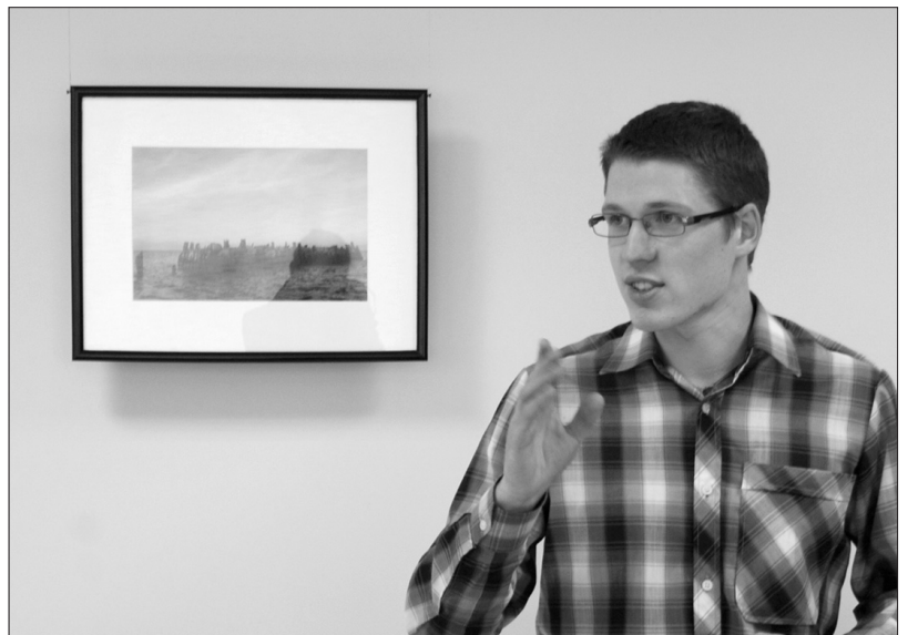
Mans tuvākais fotouzņēmums izstādē ir vecais Kaltenes mols. Tajā ir minimālisms, kuru arī cenšos jebkurā attēlā iekļaut. Tajā ir plašums, tīras debesis, senais, kas pazūd.

Kaltenē ir daudz stāstu, ko izstāstīt. Plānoju turpināt veidot stāstus ne vien par jūru un zvejniecību, bet arī par Kalteni un tās izmaiņām, attīstību. Kaut vai par to, kā mainās sabiedriskās ēkas – pasts, skola un klubs. ■