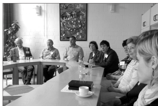
Rojas delegācija saviesīgā pasākumā Heikendorfā

viņi vienmēr domā, kā vēl varētu mums palīdzēt, un tad es prasu – ko mēs varētu dot jums? Uz to viņi atbild, ka caur šo draudzību viņi saņem lielu stiprinājumu, redzot, ka draudze pastāv, kaut arī mācītājam alga, ar ko viņš te varētu pilnībā iztikēt, netiek maksāta. Tomēr mācītājs šeit ir bijis visus 20 gadus. Ir bijuši laiki, kad ar iztikšanu bijis pavisam